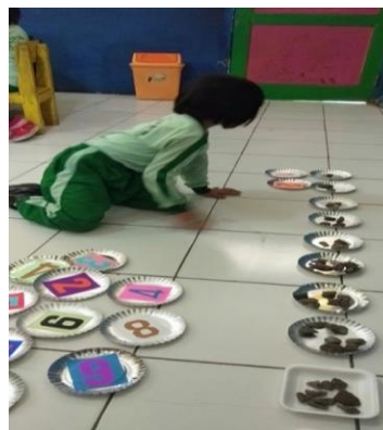
Gambar 1 Inovasi pada media pembelajaran

Pada saat diberikan stimulus melalui pendekatan pembelajaran open-ended kepada anak, guru mempersiapkan pembelajaran dengan memberikan permasalahan yang sama kepada setiap anak setelah itu guru mencoba memberikan kesempatan kepada anak untuk menyelesaikan permasalahan tersebut contoh cara penyelesaiannya akan tetapi guru membebaskan anak untuk menyelesaikan permasalahan tersebut dengan bantuan media yang sudah dibuat guru yaitu media piring kertas angka yang bertujuan untuk mempermudah anak memahami lambang bilangan. Pada penelitian ini peneliti menggunakan pendekatan pembelajaran open-ended terhadap konsep bilangan melalui media dan sumber belajar dengan memanfaatkan lingkungan yaitu dengan berinovasi dengan piring kertas yang dituliskan bilangan angka agar menarik minat belajar secara visual seperti pada gambar 1. Dalam memahami lambang bilangan melalui media piring kertas tersebut guru hanya memberikan pemahaman tentang konsep bilangan melalui ucapan yang kemudian anak mencari lambang bilangan tersebut sesuai dengan pemahaman dan kemampuan yang anak miliki.