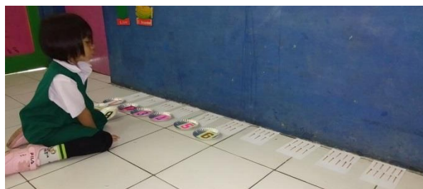
Gambar 2. Proses Pembelajaran melalui Media Piring Kertas

perkembangan anak, 8) stimulasi terpadu (Wahyudin & Agustin, 2011). Pada saat pemberian treatment, terlihat anak-anak sangat menyukainya dikarenakan anak-anak mencari penyelesaian masalah tersebut dengan kemampuan dan pemahaman yang dimiliki anak sebelumnya sehingga anak tertantang dalam menyusun strategi dalam menyelesaikannya. Hal ini sesuai dengan hasil penelitian yang dilakukan oleh Freiman (2018) bahwa melalui pembelajaran dengan pendekatan open-ended anak berada pada situasi yang menantang dalam menyelesaikan permasalahan matematika. Pada penelitian ini peneliti menggunakan pendekatan pembelajaran open-ended terhadap konsep bilangan melalui media dan sumber belajar dengan memanfaatkan lingkungan yaitu dengan berinovasi dengan piring kertas yang dituliskan bilangan angka agar menarik minat belajar secara visual seperti pada gambar 2.