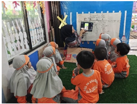
Gambar 3. Kegiatan Menonton Video Pembelajaran Melalui Perangkat Digital Tablet.

materi yang disajikan relevan dengan tujuan pembelajaran. sebagaimana ditunjukkan pada gambar 3.