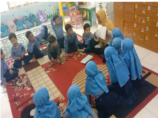
Gambar 4. Guru menggunakan Konvensional dan melakukan metode tanya jawab dengan anak. (kelas kontrol)