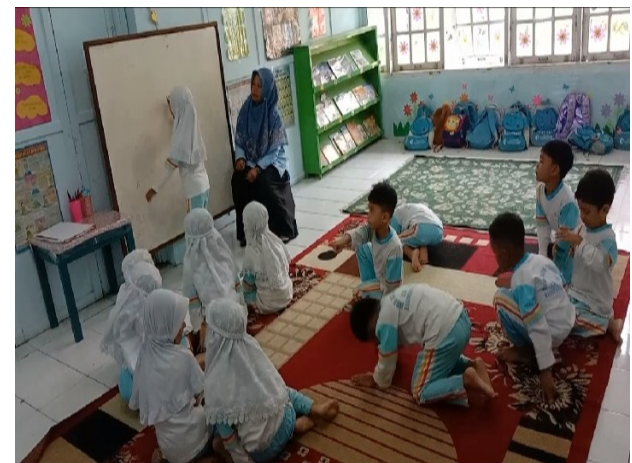
Gambar 5. Anak menjelaskan kata-kata berdasarkan metode cerita yang dibacakan (kelas kontrol)