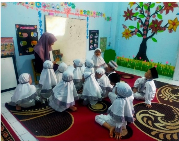
Gambar 2. Guru menyapa anak dan Berinteraksi dengan metode story reading menggunakan media buku cerita bergambar (kelas eksperimen)

Dengan demikian, hasil penelitian ini secara keseluruhan menunjukkan bahwa kegiatan story reading yang dilaksanakan secara terstruktur dan berkesinambungan tidak hanya menumbuhkan minat baca, tetapi juga menjadi sarana yang sangat efektif dalam menanamkan kesantunan berbahasa kepada anak usia dini. Hal ini membuktikan bahwa pendekatan pembelajaran berbasis cerita memiliki potensi yang besar dalam membentuk karakter anak sejak dini melalui pemanfaatan bahasa yang sopan dan bermakna. Dalam penelitian ini, pada kelas eksperimen peneliti memberikan perlakuan dengan metode story reading menggunakan media buku cerita yang berisi cerita dengan muatan kesantunan berbahasa, sedangkan pada kelas kontrol digunakan metode pembelajaran konvensional. Gambar 2, 3, 4, dan 5 menyajikan dokumentasi proses pelaksanaan penelitian ini.