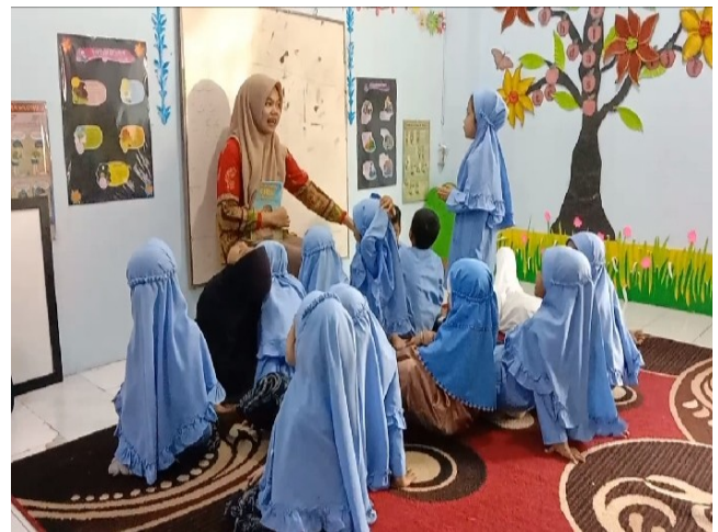
Gambar 3. Anak mengamati gambar dan menjelaskan pada kata-kata sopan berdasarkan gambar di dalam buku cerita (kelas eksperimen)