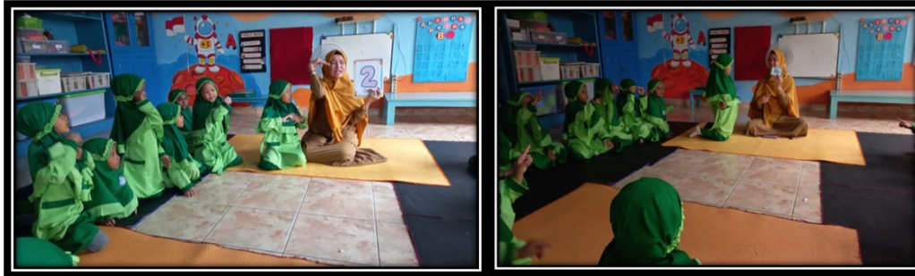
Gambar 2. Pelaksanaan Membaca Permulaan Menggunakan Media Kartu Kata Bergambar

Pada kegiatan penutup, guru mengajak anak mengulang kembali kata-kata yang telah dipelajari sebagai bentuk penguatan dan refleksi. Proses ini dilakukan dengan pendekatan yang menyenangkan agar anak tetap merasa nyaman dan termotivasi dalam belajar. Evaluasi dilakukan secara alami melalui pengamatan langsung terhadap respons dan partisipasi anak dalam aktivitas. Pendekatan ini sejalan dengan prinsip asesmen otentik dalam pendidikan anak usia dini yang menekankan pada observasi perilaku belajar dalam konteks nyata (Winandar et al., 2024).