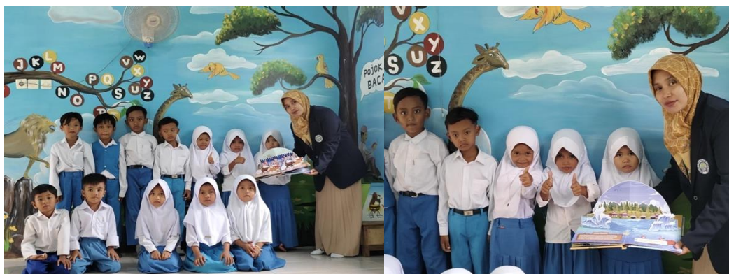
Gambar 2.: Kegiatan Uji Coba Pop Up Book "Pesona Wisata Madura"

Salah satu indikator literasi awal yang diamati dalam penelitian ini adalah kemampuan anak untuk mengidentifikasi huruf dan kata sederhana. Pada halaman tentang wisata kuliner Madura, anak-anak diajak mengeja kata "sate," "nasi jagung," dan "lorjuk." Hasil dokumentasi menunjukkan bahwa anak lebih mudah mengingat kosakata tersebut karena disertai gambar nyata dan aktivitas membuka-tutup yang memperkuat asosiasi visual dan verbal. Analisis berdasarkan kerangka Dick and Carey memperlihatkan bahwa hasil dari tahap evaluasi formatif dalam uji coba kelompok kecil memberikan data empiris yang mendukung efektivitas produk. Melalui proses umpan balik yang sistematis dan terstruktur, respon anak-anak menjadi salah satu tolok ukur utama untuk mengevaluasi keberhasilan desain instruksional. Efektivitas media tidak hanya diukur dari sisi estetika, tetapi juga dari kontribusinya terhadap peningkatan aspek literasi dan kognitif anak (Amri et al., 2023, pp. 406-411). Data ini sekaligus menunjukkan keberhasilan instruksional dari media berbasis lokalitas, sebagaimana dibuktikan pula dalam studi oleh (Triwardhani et al., 2023, pp. 1818-1827) mengenai media visual lokal dalam penguatan pemahaman konsep literasi dasar.