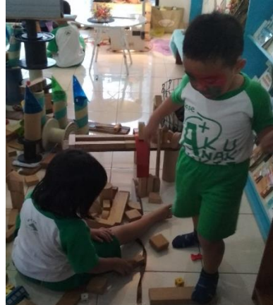
Gambar 5. Seorang teman menemani