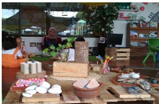
Gambar 2. Invitasi dengan jenis bahan lepasan yang berbeda (dokumen penelitian)