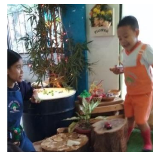
Gambar 18. Menjelaskan pada bu Guru perkembangan jamur yang baru saja disemprot air (dokumen penelitian)

Rasa percaya diri dan kemandirian anak tampak saat jam bermain maupun saat mendiskusikan kegiatan, baik sebelum usai jam belajar atau sebelum jam main. Saat bermain, rata-rata anak bermain dengan teman, entah satu orang atau lebih. Jarang sekali anak yang asyik bermain sendiri, meskipun selalu ada anak yang asyik dengan ide dan bermain sendiri untuk beberapa lama, namun tidak sepanjang waktu bermain yang tersedia. Paling tidak selalu ada teman yang menghampiri, entah sekedar mengamati atau bertanya apa yang sedang dikerjakan.