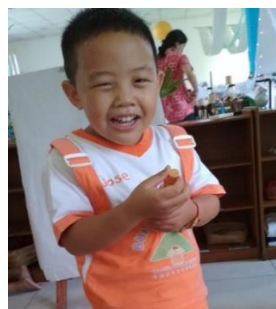
Gambar 17. Dengan ceria, anak menjelaskan fungsi air dalam botol yang dibawa (dokumen penelitian)