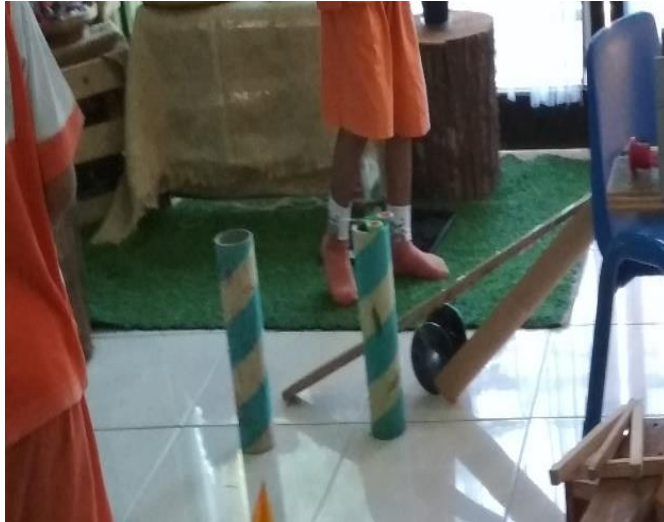
Gambar 14. Invitasi awal untuk sirkuit (dokumen penelitian)

Pagi itu beberapa anak membutuhkan benda yang harus diambil di atelier untuk menambah sirkuitnya. Anak-anak ingin memperpanjang jalur jalan dan memberi variasi. Kayu yang disandarkan Ibu Guru di salah satu pojok sebagai invitasi oleh kelompok yang lain. Seorang anak berinisiatif mengambil kayu lain dari atelier di halaman belakang.