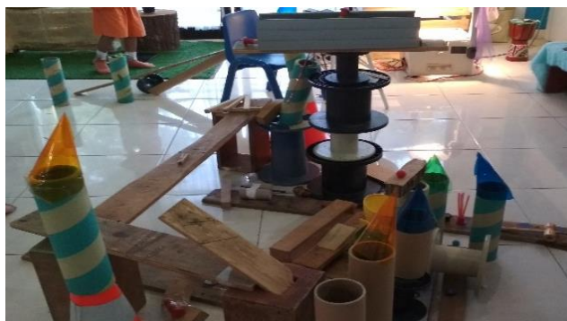
Gambar 3. Salah satu struktur skybridge (dokumen penelitian)

Pagi itu pada hari Senin, sebagian besar anak kelompok TK A masih berniat untuk melanjutkan proyek yang telah dikerjakan pada minggu sebelumnya. Ibu Guru menata invitasi sesuai dengan masukan dari anak-anak sebelum libur akhir pekan. Di dalam kelas, Ibu guru menata invitasi semacam meja rias dengan peralatan make up dan ada semacam krayon besar. Ibu guru menjelaskan, "Ini krayon untuk wajah" sambil tersenyum. Di pojok dekat jendela atau pintu kaca besar, Ibu guru menata di meja beberapa potongan kayu dan ranting pohon yang mulai mengering. Di dekat tempat itu ada potongan tebal kayu yang dipotong melintang, ada jamur di atas penampangnya. Di sebelah potongan batang kayu, Ibu guru menyandarkan 3 lempeng kayu dengan panjang sekitar 1 meter pada meja plastic pendek. Di belakang meja tersandar teropong besar, yang jelas asli. Di bawahnya tergeletak peralatan tukang asli seperti obeng, palu, selotip besar. Juga ada alat pengering rambut ( hairdryer ) dan gelondong karton dengan ukuran antara 30 hingga 40 cm.