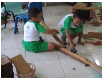
Gambar 16. Di hari lain, kayu ditambah karena model sirkuit berbeda dari yang awal (dokumen penelitian)