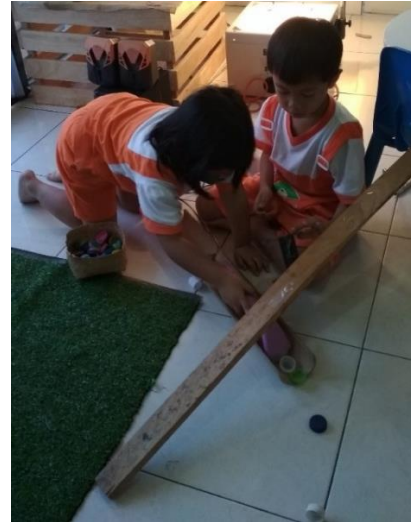
Gambar 15. Bambu disepakati pindah tempat untuk fungsi lain (dokumen penelitian)