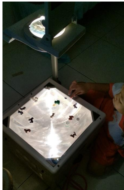
Gambar 22. Bermain wayang dengan OHP (dokumen penelitian)

Perilaku sosial merupakan salah satu karakteristik dari keterampilan bermain (Ergin & Ergin, 2017). Jika perilaku sosial yang positif meningkat dan yang negatif menurun maka keterampilan bermain anak juga akan meningkat. Perilaku sosial negatif seperti agresi fisik dan selalu memiliki perasaan tertekan, sedangkan perilaku sosial positif diantaranya kerjasama, percaya diri, tanggungjawab, dan kemandirian. Seluruh nilai-nilai ini muncul saat anak bermain bersama. Saat itu anak berinteraksi dengan teman-temannya atau anak menunjukkan sejauh mana kematangan perkembangan sikap seperti kemandirian atau kemampuan bertanggung jawab atau rasa percaya dirinya.