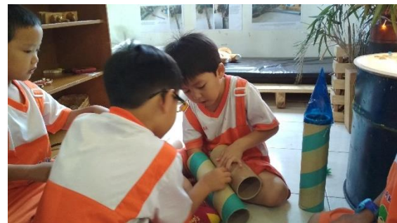
Gambar 8 Anak-anak sibuk menempelkan gelondongan untuk membuat senjata (dokumen penelitian)

Hal ini nampak pada sekelompok anak yang mengakses invitasi yang disiapkan Ibu guru pada hari yang berbeda. Invitasi tersebut terlihat sederhana, hanya berupa gelondongan berbahan kardus semacam gelondongan plastic atau tissue dapur. Juga ada gelondongan tissue biasa. Gelondongan ini ada yang berpola, ada yang polos. Sebelumnya, gelondongan ini merupakan proyek roket. Namun hari itu semua merasa roket tidak lagi bisa diperkaya dengan materi lain dan ada ide yang lebih menarik, membuat senjata roket yang nempel di tangan (lihat Gambar 8)