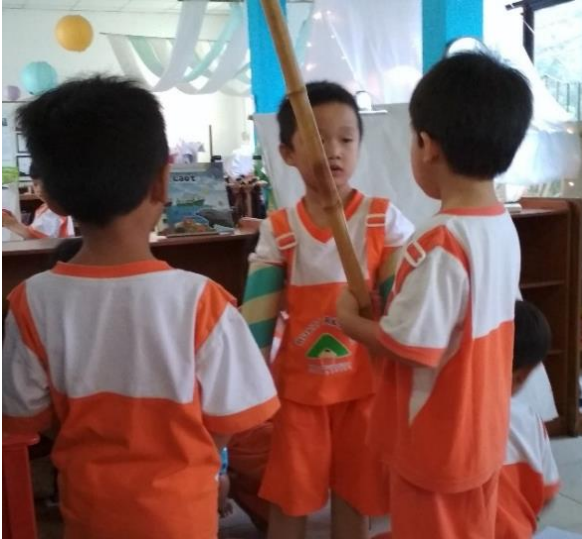
Gambar 19. Saling menceritakan ide tentang senjata yang akan dibuat (dokumen penelitian)