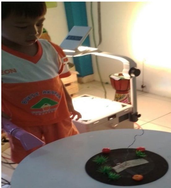
Gambar 21. Bermain dengan hairdriyer , membuktikan macam-macam benda yang mampu bergerak karena tiupan angin alat tersebut. (dokumen penelitian)

jawab akan keselamatan diri sendiri dan orang lain, anak dapat memainkan dengan prosedur yang benar dan terhindar dari bahaya.