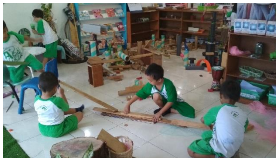
Gambar 7. Anak menambahkan bahan lepas pada invitasi (dokumen penelitian)