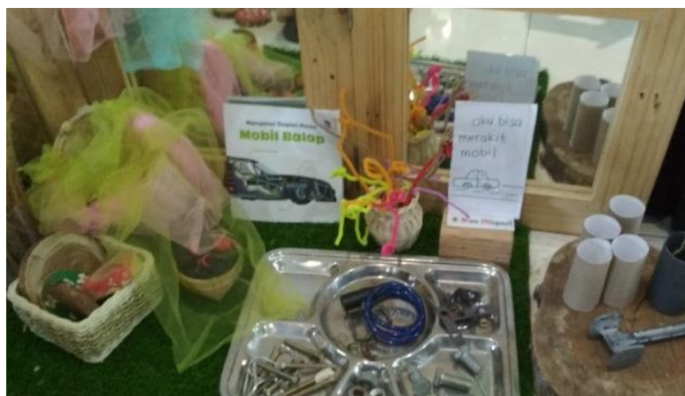
Gambar 13. Kain-kain yang memperkaya invitasi ini sebagian besar diambil dari atelier (dokumen penelitian)