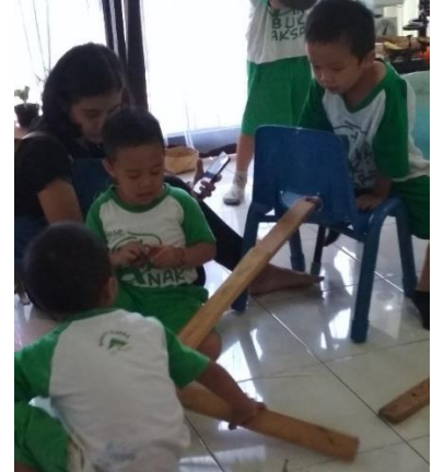
Gambar 6. Invitasi awal mulai diubah (dokumen penelitian)