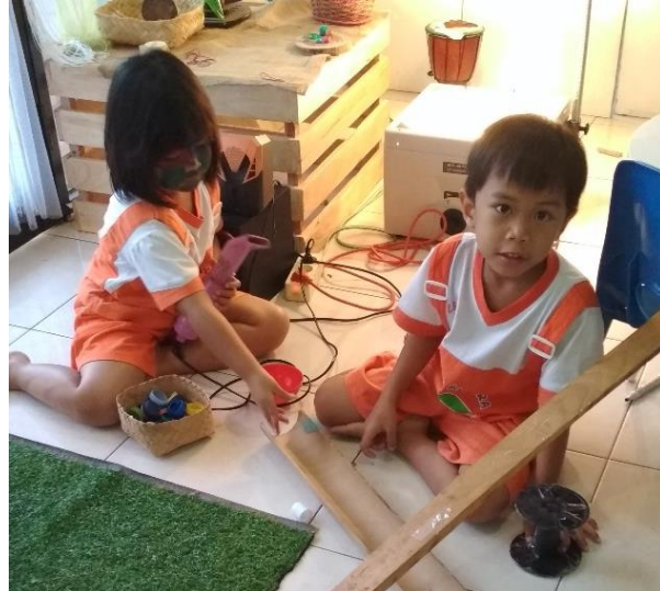
Gambar 20. Dengan percaya diri menggunakan alat elektronik asli secara mandiri untuk mengeksplorasi media (dokumen penelitian)

Seorang anak dengan percaya diri menjelaskan apa yang akan dikerjakan, saat ditanya tentang mengapa dia membawa botol berisi air, "Ini untuk menyiram jamur. Waktu sebelum libur kemarin, jamurnya masih bagus, sekarang ada yang sudah kering". Lalu dia menyemprot jamur yang ada di penampang potongan batang pohon. Bu Guru mendekati dan bertanya apakah dia masih akan melanjutkan untuk mengamati jamurnya. Anak mengiyakan. Bu Guru bertanya lagi, mengapa jamurnya ada yang seperti terpotong. Sambil tersenyum-senyum, anak itu menjawab, "Sepertinya jamurnya dimakan tikus". Ibu Guru seakan kaget mendengar jawabannya dan bertanya, "Darimana tikus bisa masuk ke sini dan memakan jamur?" Masih sambil tersenyum anak itu menjawab, "Itu di sana kan ada pintu (dia menunjuk pintu yang menuju ke halaman belakang), nah tikus masuk dari pintu. Lalu dia mencium bau jamur dan mencari. Terus ketemu jamur ini dan dia makan. Lalu tikus naik ke tembok dan keluar lewat pipa AC". Bu Guru memperhatikan keterangan itu dengan serius, kemudian mendongak ke atas melihat AC, "Tapi kabel AC tidak ada lubangnya". Anak itu menjawab lagi, "Ya berarti tikus sembunyi dulu. Dia keluar saat pintu ini dibuka", katanya sambil melihat pada pintu besar di kelasnya yang berfungsi untuk pencahayaan. Lalu dia beranjak pergi.