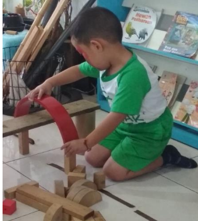
Gambar 4. Anak mengawali proyek membangun technopark sendirian (dokumen penelitian)

Suatu material yang sederhana dan hanya merupakan bahan bekas ternyata dapat menjadi suatu karya unik yang menarik. Dari hasil dialog dan olah kreativitas antar anak, karya tersebut dapat menggambarkan kemampuan berpikir dan pengetahuan anak tentang wacana yang lebih kompleks dibanding bila kegiatan bermain tersebut disetting oleh guru dalam bentuk penugasan.