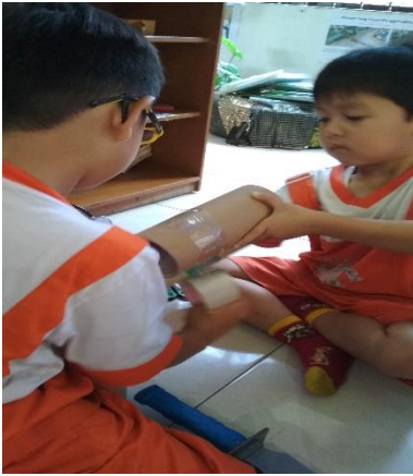
Gambar 9. Merekat dengan selotip besar (dokumen penelitian)