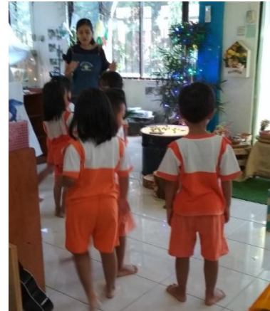
Gambar 11. Saat sebelum mulai kegiatan pembukaan (dokumen penelitian)

Sampai kemudian seorang teman yang lain yang memperhatikan kesibukan itu memberi saran untuk menggunakan selotip yang besar. Teman yang sedang tidak sibuk membantu menempel kemudian berlari untuk meminjam selotip plastik besar karena di kelas persediaan selotip plastik besar sudah habis. Dia menemukan selotip di atelier dan membawa kembali ke kelas pada dua temannya yang masih sibuk. Seorang teman membantu untuk memasang senjata dari gelondongan dengan selotip besar. Setelah beberapa saat, akhirnya tercipta senjata yang terpasang di tangannya (lihat gambar 10). Teman yang ikut membantu sejenak mengamati dengan lega, kemudian dia pun berpikir untuk membuat model senjatanya sendiri.