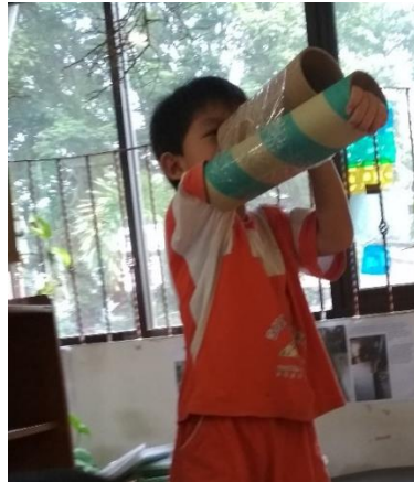
Gambar 10. Akhirnya berhasil membuat senjata yang menempel di tangan (dokumen penelitian)