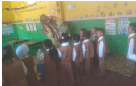
Gambar 3. Menyampaikan Islamic Story dengan metode pantonim (PAUD Al Haromain Puger-Jember)