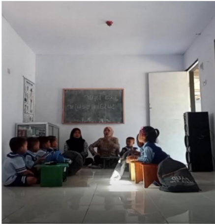
Gambar 4. Guru menyampaikan cerita sembari memberikan pertanyaan kepada peserta didik (PAUD Nurul Ilmi Pujer-SItubondo)