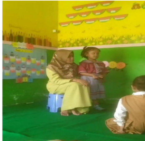
Gambar 5. Anak melakukan persentasi di depan kelas, mengutarakan pendapat mengenai islamic story yang telah di dengar

Setiap kelas tidak hanya dijadikan sebagai tempat penyerapan informasi, akan tetapi juga bisa dijadikan sebagai panggung untuk peserta didik untuk terlibat secara aktif. Partisipasi aktif peserta didik di kelas sangat penting untuk mendorong pemikiran kritis, membangun pengetahuan bersama, dan mengasah keterampilan penalaran anak. Melalui dialog yang produktif, anak bisa menuangkan ide, memperluas wawasan, dan belajar secara efektif. Guru dapat memainkan peran penting dengan meningkatkan keterampilan peserta didik dalam memfasilitasi dialog yang membangun (Vrikki et al., 2019).