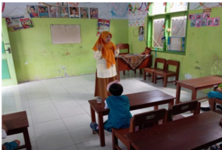
Gambar 2. Guru Menyampaikan Islamic Story dengan metode ceramah (PAUD Lemuru Puger-Jember)

Pada bagian ini hasil wawancara yang dilakukan kepada guru-guru dari tiga satuan unit PAUD yang berbeda. Para narasumber tersebut memiliki latar belakang pernah mengenyam pendidikan pondok pesantren, sehingga para guru memiliki pola pikir yang unik dalam menentukan gaya mengajarnya. Narasumber menerangkan bahwa dalam kegiatan mengajar, para guru lebih menekankan pembelajaran berbasis cerita dengan bermain dalam menciptakan suasana kelas agar lebih hidup. Petunjuk dan kreteria pembelajaran sudah termuat dalam RPPH, akan tetapi bahan ajar yang sering disampaikan lebih cenderung dihubungkan dengan materi islami, yang penyampaiannya menggunakan berbagai metode mulai dari bercerita, nyanyian, atau pertunjukan. Materi yang diajarkan misalnya merupakan cerita nabi-nabi, nyayian berupa nasyid yang menceritakan silsilah nabi, dan pertunjukan cerita lebih mirip pantonim.