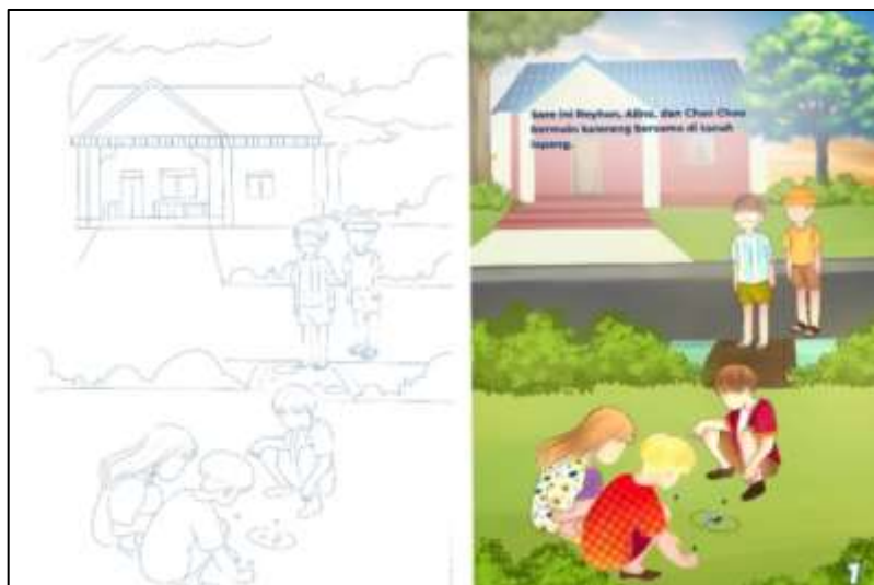
Gambar 1. Ilustrasi sebelum dan sesudah diwarnai

Tipografi teks yang digunakan jenis Montserrat Font yang dikenal memiliki kejelasan, keteraturan, dan mudah dibaca (Khallil, 2020). Dalam cerita ini, warna-warna yang digunakan menonjolkan tampilan yang mencolok dan menggunakan kombinasi warna yang beragam untuk menarik perhatian anak-anak. Ini sesuai dengan pandangan Ngura (2021) bahwa pemilihan warna yang tepat dapat menciptakan kesan yang harmonis. Penggunaan warna yang terlalu gelap atau kusam tidak dianjurkan karena dapat mengganggu penglihatan anak dan mengalihkan perhatian mereka. Gambar ilustrasi cerita dapat dilihat pada gambar 1 .