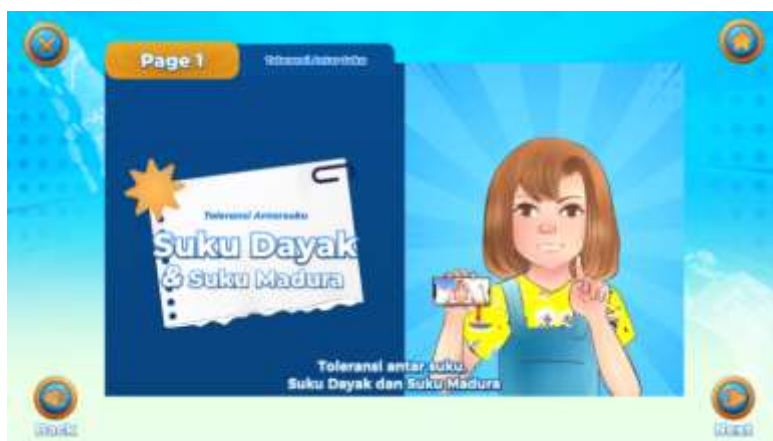
Gambar 2. Tampilan E-Story Book

Langkah selanjutnya E-Story Book ini dinilai kelayakannya oleh para ahli, khususnya ahli materi dan ahli media. Hasil validasi dari para ahli dapat digunakan untuk menentukan apakah E-Story Book yang dibuat memungkinkan untuk digunakan. Validator ahli materi bertugas untuk menilai dan memberi masukan serta saran pada naskah cerita yang diciptakan. Sama seperti validator ahli materi, validator ahli media juga memiliki tanggung jawab untuk mengevaluasi dan memberikan masukan serta saran terkait media E-Story Book . Penilaian naskah cerita mengacu pada Permendikbud ristek 25 Tahun 2022 tentang Penilaian Buku Pendidikan yang disusun oleh Pusat Perbukuan, Badan Standar, Kurikulum, dan Asesmen Pendidikan. Sedangkan penilaian media merujuk kepada pedoman penilaian buku nonteks pelajaran yang telah ditetapkan oleh Badan Standar Nasional Pendidikan (BSNP) dan juga berdasarkan hasil penelitian sebelumnya.