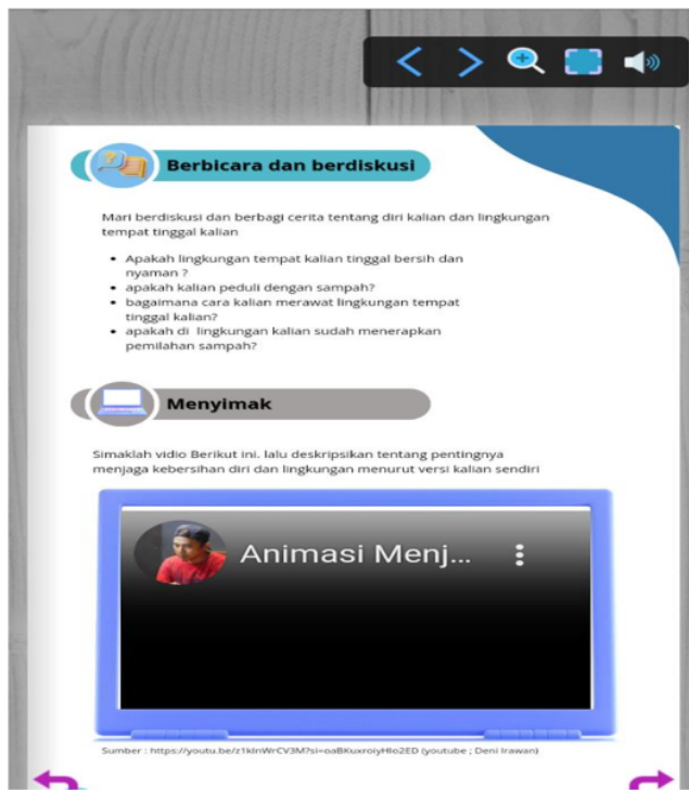
Gambar 3. Desain Pembelajaran Berbasis Wawasan Lingkungan

Selanjutnya, pada aspek keterampilan berkaitan dengan penerapan pengetahuan ekologi dalam kehidupan sehari-hari. Konten lingkungan diintegrasikan pada keterampilan berbahasa yakni menyimak. Konten lingkungan disajikan dalam bentuk animasi yang mengilustrasikan pentingnya menjaga kebersihan diri dan lingkungan. Melalui keterampilan menyimak, siswa dapat memperhatikan gambar dan cerita yang disajikan dalam media. Gambar dan cerita tersebut dapat memberikan dampak pada diri siswa berupa keterampilan dalam menjaga kebersihan.