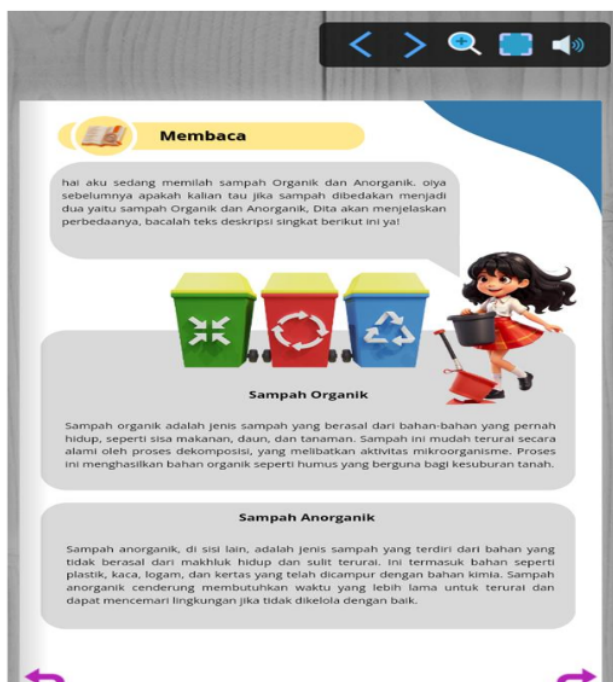
Gambar 1. Desain Pembelajaran Berwawasan Lingkungan

Dalam pembelajaran Bahasa Indonesia, ekoliterasi diposisikan sebagai tema (konten) yang mewarnai substansi pembelajaran. Tentunya penggunaan konten lingkungan disesuaikan dengan materi Bahasa Indonesia agar capaian pembelajaran dapat tetap tercapai. Desain pembelajaran Bahasa Indonesia berwawasan lingkungan sebagai berikut: