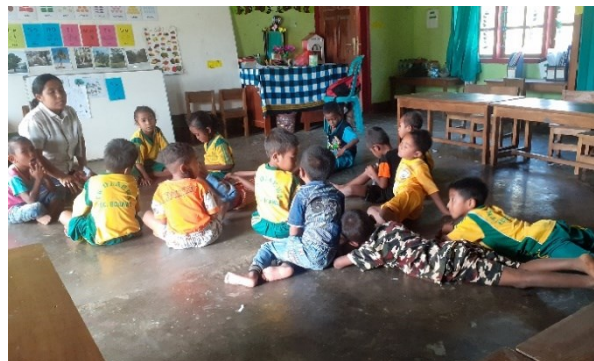
Gambar 3. Terlihat Anak Tidak Menyimak Penjelasan Guru