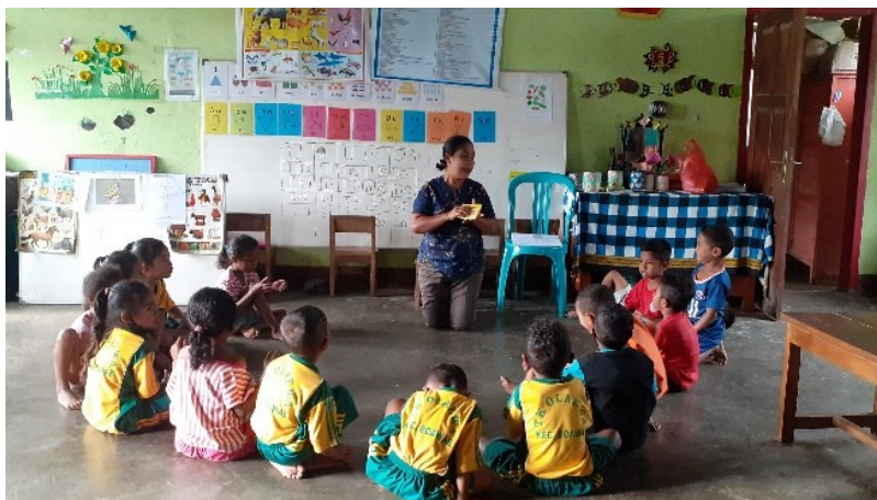
Gambar 4. Situasi Kelas menggunakan bahasa ibu

Seperti yang diungkapkan oleh Purba, (2021) bahwa salah satu dampak positif penggunaan bahasa ibu sebagai bahasa pengantar pembelajaran adalah memudahkan anak memahami materi yang diberikan dan sekaligus menjadi jembatan bagi anak memahami bahasa kedua, dalam hal ini bahasa nasional, yang secara hukum merupakan bahasa resmi dalam pengajaran. Di samping itu, menurut Ball, Ward., & Bernede, (2014), keuntungan penggunaan bahasa ibu dalam proses pembelajaran adalah anak-anak termotivasi untuk bersekolah dan memudahkan mereka untuk menguasai pelajaran di sekolah serta orang tua akan terdorong untuk berpartisipasi dalam pembelajaran anak-anaknya. Penggunaan bahasa ibu dalam proses pembelajaran di kelas dapat mempermudah proses belajar mengajar karena peserta didik dapat menguasai dan memahami materi yang disampaikan oleh guru dengan setiap pembelajaran tidak harus dipaksakan menggunakan bahasa Indonesia (Hernawati, 2017).