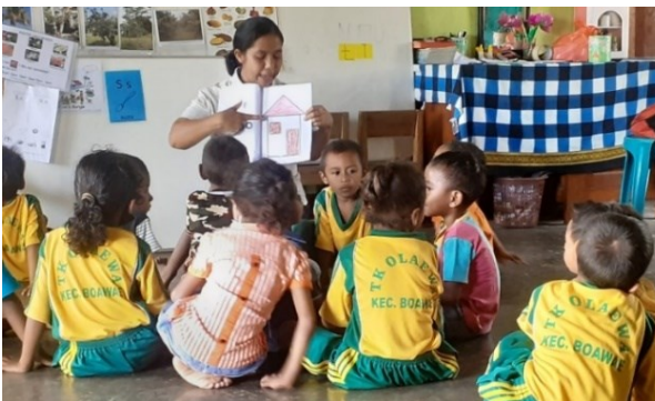
Gambar 2. Beberapa anak sibuk bercakap dengan temannya

Implementasi bahasa ibu pada proses pembelajaran di TKK Olaewa berangkat dari rendahnya keterlibatan dan interaksi anak pada kegiatan belajar dan bermain bersama guru. Hal ini menjadi permasalahan yang dihadapi oleh anak-anak yang bahasa ibunya adalah bahasa daerah mengalami kesulitan memahami materi yang diajarkan dengan menggunakan bahasa pengantar bahasa Indonesia sebagai bahasa resmi pembelajaran. Berdasarkan hasil observasi ditemukan bahwa anak cenderung asyik dengan kegiatannya sendiri sehingga terkesan tidak mendengarkan penjelasan materi oleh guru. Selain itu, anak kurang ekspresif pada saat menggunakan bahasa Indonesia dan kurang percaya diri menggunakan bahasa Indonesia. Situasi tersebut dapat terlihat pada foto-foto kegiatan pembelajaran sebagaimana pada gambar 2 dan gambar 3 .