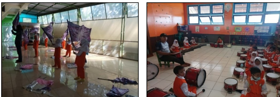
Gambar 2. Kegiatan Ekstrakurikuler Drumband