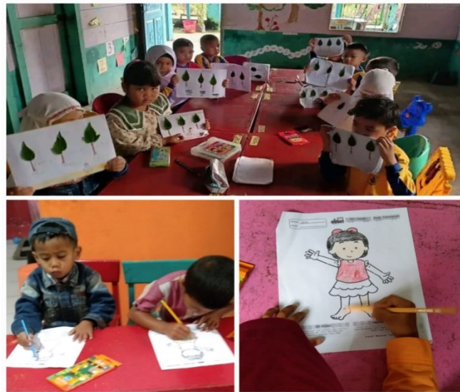
Gambar 3. Dokumentasi selama kegiatan

mencapai tujuan yang ditetapkan. Refleksi hasil ini memandu perencanaan pembelajaran mewarnai pada siklus II untuk meningkatkan kemampuan motorik halus anak.