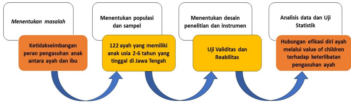
Gambar I. Tahapan Penelitian