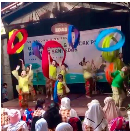
Gambar 4. kaulinan urang lembur di Kampung Seni Edas

Kaulinan urang lembur adalah sajian utama dalam pertunjukan ini. Tampilan dimulai pukul 10.10 wib, kaulinan urang lembur merupakan adaptasi dari permainan masa kecil yang selama ini ada di kehidupan masyarakat orang kampung. Kaulinan Urang Lembur seperti gegerelengan , totorolokan , sered upih , perepet jengkol , babalonan , silu doyong , kalongking , dan masih banyak lagi yang biasanya dimainkan secara sportif di lapangan arena atau tempat bermain diangkat ke dalam sebuah seni pertunjukan yang dikemas secara atraktif dengan pola gerak dan tari yang dinamis.