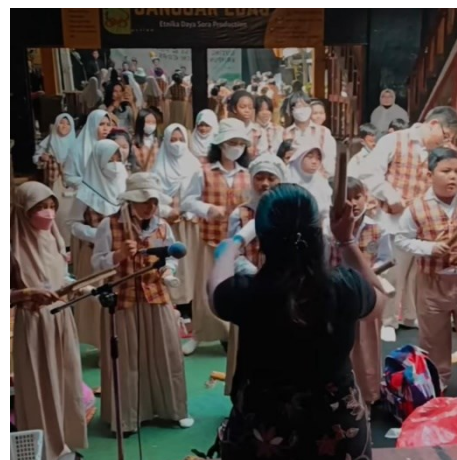
Gambar 9. Siswa - siswi SD Bosowa Bina Insani mempertunjukan permainan musik interaktif