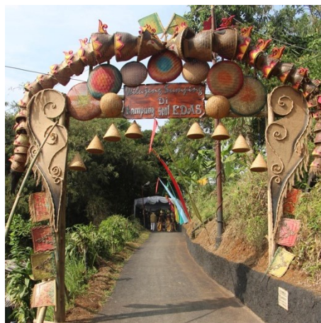
Gambar 3. Gapura Kampung Seni Edas

Penyajian dimulai pada pukul 10.00 wib setibanya rombongan tiba di gapura Kampung Seni dengan disambut lengser dan musik, kemudian sempainya di lokasi acara masing-masing dipasangkan tiket berbentuk gelang lalu diberikan welcome drink dan kudapan tradisional khas sunda. Setelah itu, penabuh memainkan musik gamelan sebagai pembuka yang bertujuan untuk menarik perhatian pengunjung yang datang ke lokasi pertunjukan.