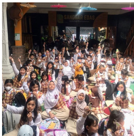
Gambar 1. Siswa SD Bosowa Bina Insani belajar kesenian sunda di Kampung Seni Edas

Peneliti telah mengobservasi pertunjukan seni di Kampung Seni Edas pada hari rabu tanggal 10 Mei 2023. Ketika itu, Sekolah Dasar (SD) Bosowa Bina Insani mengenalkan siswa-siswi pada kesenian sunda melalui kunjungan ke Kampung Seni Edas, berjumlah 51 orang siswa-siswi kelas empat dan 5 guru pendamping. Tujuan kunjungan ke Kampung Seni Edas adalah dalam rangka outing class dan puncak P5. Kegiatan tersebut juga termasuk ke dalam elemen mengalami ( experiencing ) yang menjadi salah satu elemen dasar capaian pembelajaran pada kurikulum merdeka belajar yang sebelumnya sudah dilakukan di SD Bosowa Bina Insani.