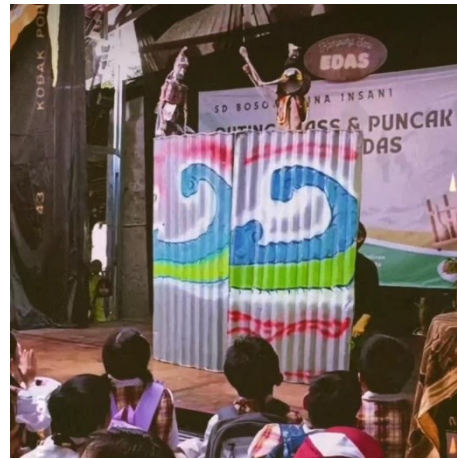
Gambar 7. Kesenian wayang kaleng di Kampung Seni Edas

Kemudian dilanjutkan dengan penampilan wayang kaleng , adalah wayang jenis baru yang merupakan hasil eksplorasi dengan memanfaatkan bahan dasar limbah yakni kaleng-kaleng bekas. Lahirnya wayang kaleng adalah wujud sosial dalam rangka pemanfaatan limbah kaleng menjadi barang yang lebih berguna dengan sentuhan seni yang kreatif menjadi sebuah wayang yang baru (Hadiatiningrum et al., 2022). Penyajian tari wayang kaleng yang diciptakan oleh Ade Suarsa memiliki kebaruaran berupa inovasi atas ide Ade, dalang dalam pagelaran wayang lainnya biasanya dilakukan oleh satu orang saja tetapi perbedaan dalam tari wayang kaleng yaitu Sosok dalang diganti oleh penari yang merangkap sebagai penyanyi atau sinden. Fungsi wayang kaleng kurang lebih sama, diantaranya fungsi pendidikan, sosial dan hiburan.