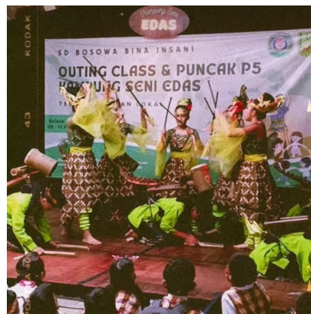
Gambar 5. Kesenian langgir badong di Kampung Seni Edas

Selanjutnya pada pukul 10.21 adalah tampilan langgir badong , merupakan pertunjukan musik yang instrumennya terbuat dari bambu, dalam kemasan pertunjukannya terdapat keragaman bunyi seperti fungsi kentongan, kecrek, bedug dan gambang salendro yang secara bentuk menyerupai langgir (kalajengking) yang ekornya diberi ornamen senjata Pring Kujang sesuai dengan namanya menyerupai langgir atau kalajengking. Sementara badong dapat juga diartikan sebagai bambu yang digendong, karena alat tersebut dapat disajikan dengan cara digendong sebagai perangkat musik arak - arakan. Dalam pertunjukan alat musik tersebut akan dipadu dengan musik gambang katung dan dikemas inovatif dengan olahan gerak tari yang dibawakan oleh gadis-gadis cantik yang ceria dan enerjik (Deyananda et al., 2022). Desain alat musik langgir badong mendapat predikat desain alat musik terbaik yang terbuat dari bambu dan sudah memiliki hak cipta baik desain maupun bentuk pertunjukannya dari KEMENKUMHAM RI. Langgir badong diciptakan oleh Ade Suarsa pada tahun 2009.