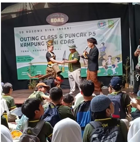
Gambar 8. Kesenian Lodong Bogor di Kampung Seni Edas

Tampilan terakhir adalah lodong bogor . Merupakan tarian yang terinspirasi dari kegiatan petani gula aren dalam menyadap air nira atau enau di pohon aren sebagai bahan dasar pembuatan gula aren yang divisualisasikan dalam tarian dan musik lodong bogor . Bentuk lodong bambu tersebut menginovasi bentuk alat musik yang dibuat hanya dicari suaranya dan dipadupadankan dengan waditra dog-dog (kendang kecil satu muka) sehingga warna bunyinya bisa dibuat sebuah komposisi musik karawitan seperti halnya kendang Sunda. Penampilannya biasanya dimainkan oleh para gadis di kemas sesuai dengan kebutuhan pertunjukan yang di inginkan. Diciptakan tahun 2008, Lodong Bogor menggambarkan kesungguhan berproses dan totalitas dalam berbuat pasti akan menghasilkan sesuatu yang manis seperti manisnya gula dari gula aren tersebut (Prabandari et al., 2018).