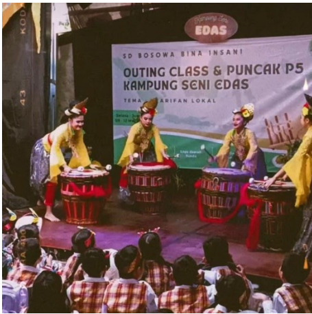
Gambar 6. Kesenian tunggul kawung di Kampung Seni Edas