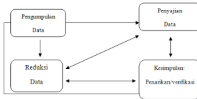
Gambar 2 Teknik analisis data triangulasi

Teknik analisis data penelitian ini yaitu menggunakan teknik triangulasi metode yang digunakan untuk memperkuat validitas dan keandalan temuan dalam penelitian kualitatif. Berikut alur teknik analisis data.