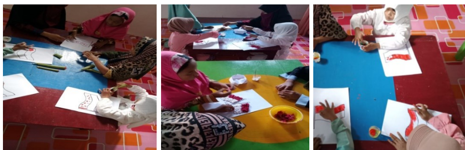
Gambar 6. Kegiatan Mengenalkan Bendera Merah Putih

Guru menstimulasi anak untuk bercerita tentang hasil karya yang telah dibuat dengan bahasa mereka sendiri. Kegiatan ini diperkuat oleh pendapat (Faridawati et al., 2019) bahwa kegiatan menunjukkan hasil karya kolase dengan bercerita sangat cocok dan dapat menjadi alternatif bagi guru untuk menstimulasi perkembangan bahasa ekspresif anak khususnya keterampilan berbicara. Guru menutup kegiatan pembelajaran dengan menstimulasi anak untuk menceritakan perasaannya pada saat melakukan kegiatan, kemudian menanyakan warna bendera Negara Indonesia, dan anak-anak riuh menjawab “merah putih” selanjutnya guru memberikan penguatan dan nasehat kepada anak tentang sejarah warna bendera Negara Indonesia kemudian mengajak anak untuk bernyanyi bersama sesuai dengan tema dan sub tema yang dipelajari hari itu.