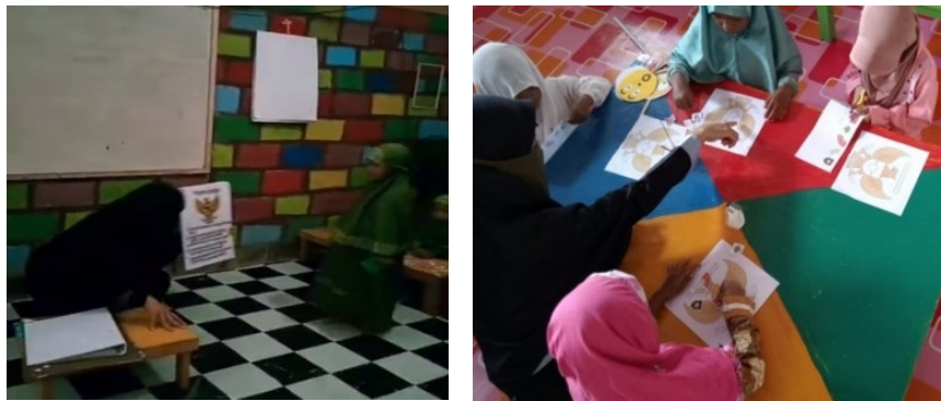
Gambar 3. Disajikan Kegiatan menempel simbol-simbol pada Burung Garuda

menstimulasi perkembangan motorik halus dan kreativitas anak usia dini (Mayantasari et al., 2022).