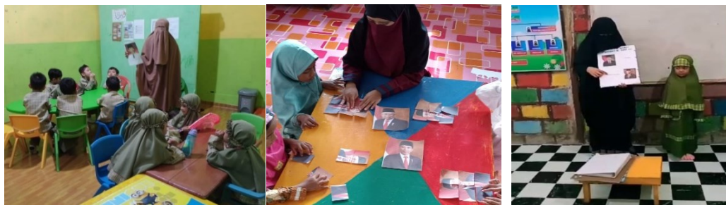
Gambar 5. Kegiatan Mengenalkan Presiden dan Wakil Presiden

Dari kegiatan bermain ini terlihat beberapa anak keliru dalam menebak sehingga hadiahnya sedikit sedangkan anak-anak yang menebak dengan benar hadiah yang diberikan lebih banyak. Pemberian hadiah dimaksudkan untuk memotivasi anak dalam melakukan kegiatan yang lebih baik. Kegiatan ditutup dengan guru menstimulasi anak untuk bercerita tentang pengalamannya dalam menonton presiden dan wakilnya saat berbicara di tempat-tempat umum.