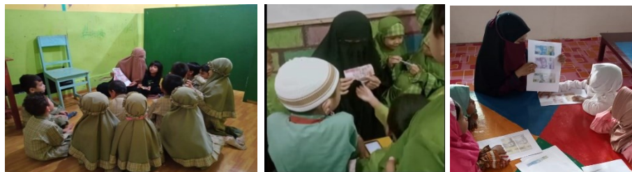
Gambar 8. Kegiatan Mengenalkan Pahlawan Bangsa Pada Mata Uang Rupiah

Setelah kegiatan bercerita tentang masing-masing pahlawan dalam setiap mata uang, selanjutnya guru menyampaikan kepada anak-anak untuk bersiap bermain “tebak nama” pada gambar pahlawan yang ditunjukkan guru terkait pada mata uang kertas yang telah diceritakan sebelumnya dan menyampaikan aturan main pada game tersebut. Anak-anak terlihat senang dan gembira serta menyetujui aturan main yang disampaikan guru. Kegiatan bermain dimulai dengan guru membagi anak menjadi 3 kelompok untuk menentukan regu dan nilai masing-masing anak. Pembelajaran metode kelompok tersebut dikuatkan oleh (Hijriati, 2017) yang menjelaskan bahwa pembelajaran kelompok sangat efektif untuk guru dalam mengelola kelas dan anak dapat mudah berinteraksi maupun berkomunikasi dengan teman sehingga anak dapat berkembang dan dapat memahami konsep-konsep baru. Permainan didesain menjadi babak rebutan dalam menebak gambar. Permainan sangat seru dan anak-anak fokus mengamati gambar dan teman lainnya berdiskusi tentang jawabannya. Anak-anak senang bermain tebak nama pada gambar pahlawan yang ada di masing-masing mata uang. Berdasarkan wawancara terhadap beberapa anak setelah kegiatan selesai, mengungkapkan bahwa mereka masih ingin bermain lagi namun waktu pembelajaran telah berakhir.