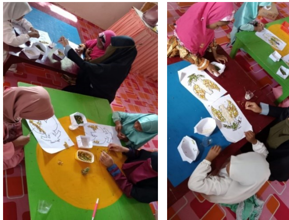
Gambar 4. Disajikan Kegiatan Kolase Burung Garuda

berupa bintang dan jempol sedangkan anak yang menebak salah harus memimpin bernyanyi untuk temannya, sebagaimana diungkapkan oleh (Astari et al., 2020) bahwa hadiah atau reward yang berbentuk nonverbal seperti yang dilakukan guru tersebut adalah suatu bentuk perilaku yang menyenangkan anak dan memiliki dampak positif untuk diri anak agar mereka termotivasi membiasakan diri untuk menjadi yang lebih baik dalam kehidupannya. Kegiatan pembelajaran ditutup dengan guru mengarahkan anak-anak untuk membaca Pancasila secara bersama-sama dan menstimulasi anak untuk bercerita tentang perasaannya selama proses pembelajaran. Selanjutnya anak-anak bernyanyi bersama guru dan berdoa menutup pembelajaran yang dipimpin oleh salah seorang anak.