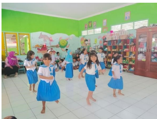
Gambar 2. Suasana latihan Tari Topeng Ireng

Tahap evaluasi yaitu dilakukan dengan cara mengevaluasi hasil kegiatan pada hari itu. Evaluasi dilakukan dalam bentuk pemaparan tarian yang sudah anak-anak hafal. Evaluasi terdiri dari detail gerak, tepat tidaknya ketukan gerakan dengan iringan musik. Selain itu evaluasi tidak hanya dilakukan oleh guru seni saja, melainkan kepala sekolah dan guru juga ikut mengevaluasi tari yang dilakukan oleh anak. Hal tersebut bertujuan agar bisa menyamakan persepsi antara sekolah dengan guru seni. Selain itu agar tercapainya tujuan pembelajaran seni tari pada anak. Suasana latihan Tari Topeng ireng disajikan pada gambar 2.