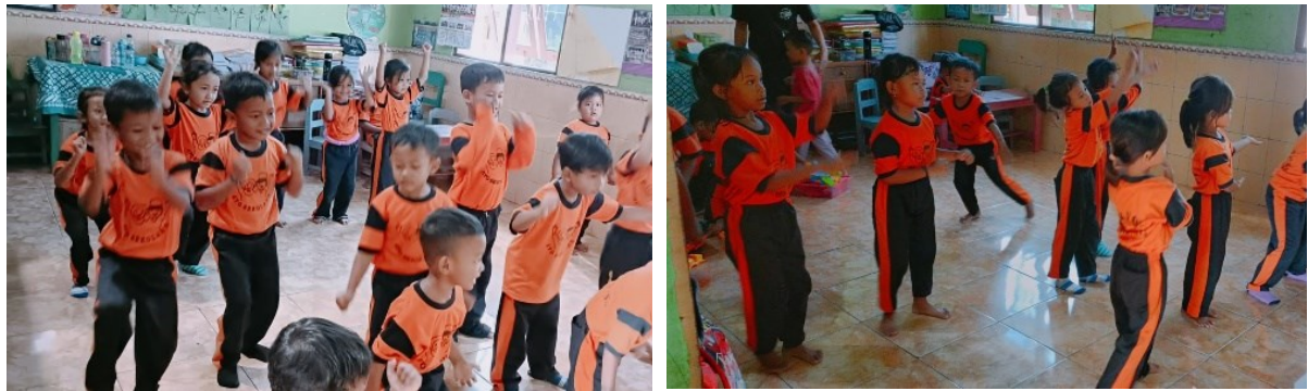
Gambar 1. Suasana ketika anak menari "Tari Tikus Buntung"

Tari tikus buntung dilakukan oleh semua anak di TK PGRI Juwiring Klaten. Anak-anak sangat senang dan antusias ketika menari tari tikus buntung ini. Hal tersebut dapat dilihat dari hasil dokumentasi yang dilakukan oleh peneliti. Gambar 1 disajikan suasana saat anak menari Tari Tikus Buntung.