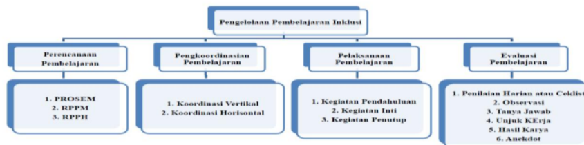
Gambar 2. Pengelolaan Pembelajaran PAUD Inklusi Saymara Kartasura

Hakikatnya pendidikan adalah hak bagi setiap warga negara Indonesia, karena pendidikan merupakan proses sistematis dengan tujuan membantu anak mengembangkan potensi yang dimiliki. Kebutuhan yang sangat penting bagi setiap manusia adalah pendidikan. Jalur pendidikan yang berlangsung di sekolah merupakan pendidikan formal. Pembelajaran dibutuhkan dalam penyelenggaraan pendidikan. Pengelolaan pembelajaran merupakan merencanakan kegiatan pembelajaran untuk dilaksanakan guru agar memiliki tujuan yang jelas dalam proses pembelajaran (Yusnira, 2015). Berdasarkan hasil penelitian menunjukkan bahwa pengelolaan pembelajaran PAUD Inklusi Saymara Kartasura meliputi: perencanaan, pengkoordinasian, pelaksanaan dan evaluasi. Pengelolaan pembelajaran PAUD Inklusi Saymara Kartasura dapat dilihat pada gambar berikut :