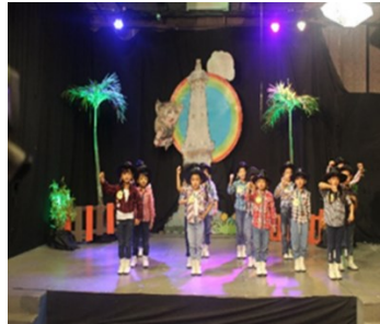
Gambar 2. Pentas Vokal di Jogja TV