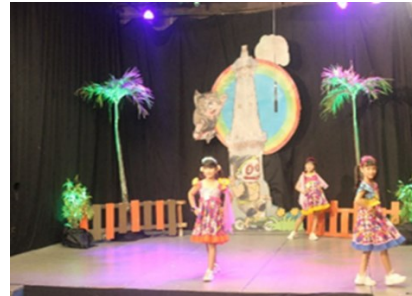
Gambar 3. Pentas Fashion Show di Jogja TV

Kegiatan pengembangan seni di TK Negeri 2 Yogyakarta sangat didukung baik internal maupun eksternal sehingga berjalan dengan lancar. Melalui kegiatan pentas seni di Jogja TV ini sebagai ajang eksistensi dan promosi kelembagaan di TK Negeri 2 Yogyakarta karena salah satu tujuan kegiatan ini adalah memperkenalkan keberadaan TK Negeri 2 Yogyakarta dengan melalui kegiatan acara dialog antara presenter TV dengan Kepala TK Negeri 2 Yogyakarta pada saat acara Ceria Anak berlangsung. Kegiatan ini terus dilakukan oleh lembaga sebagai ajang eksistensi dan promosi lembaga tersebut. Hasilnya banyak orang tua dan masyarakat yang semakin mengenal TK Negeri 2 Yogyakarta. Hal ini sesuai dengan pendapat dari Aristi (2020) dan Irani et al. (2021) yang menyatakan bahwa pentas seni dapat digunakan sebagai media promosi lembaga pendidikan. Orang lain dapat dengan mudah melihat dan tertarik dengan penampilan yang ditunjukkan oleh lembaga lewat pentas seni