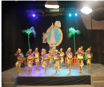
Gambar 1. Pentas Tari di Jogja TV

Target dan sasaran pentas seni di Jogja TV yaitu: (1) Mengenalkan secara luas kepada masyarakat tentang keberadaan dan keunggulan TK Negeri 2 Yogyakarta, (2) Memperkenalkan berbagai kegiatan TK Negeri 2 Yogyakarta yang dapat meningkatkan kemampuan, potensi, dan kreativitas anak. Peserta pentas seni anak di Jogja TV adalah semua peserta didik TK Negeri 2 Yogyakarta. Acara dilaksanakan dengan kegiatan menari, fashion show , menyanyi/ vocal dan dialog. Kegiatan ini melibatkan seluruh guru, karyawan, komite, peserta didik, orang tua peserta didik Taman Kanak-Kanak Negeri 2 Yogyakarta. Adapun foto kegiatan pentas seni disajikan pada Gambar 1, Gambar 2, dan Gambar 3.