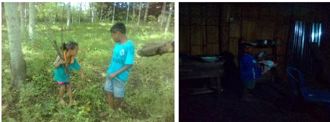
Gambar 9. anak memiliki karakter tolong-menolong kepada sesama

Dengan demikian setiap bunyi dari lirik syair di atas mengajarkan makna agar anak cucu suku Belu memiliki tanggung jawab yang tinggi terhadap hidupnya. Setiap keputusan yang diambil dalam hidup harus dipertanggungjawabkan. Pekerjaan yang diberikan oleh orang tua ataupun lingkungan harus dikerjakan dengan tanggung jawab. Teladan yang diberikan oleh budaya suku Belu melalui teladan orang tua dan masyarakat serta lingkungan sekitar memberikan dampak yang baik terhadap karakter anak suku Belu.