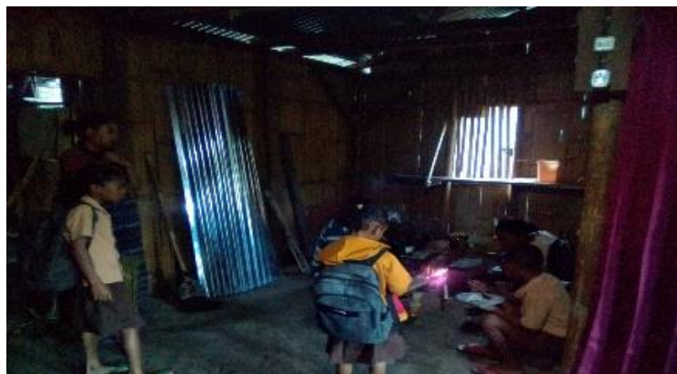
Gambar 7. Anak-anak menunggu temannya untuk berangkat bersama ke sekolah

Dengan mengembangkan perasaan peduli orang lain, menyayangi orang lain maka dapat dikatakan anak akan tumbuh menjadi pribadi yang penuh dengan kasih sayang, penuh dengan kepedulian terhadap sesama, dan penuh rasa tanggap atau peka terhadap lingkungan sekitar.