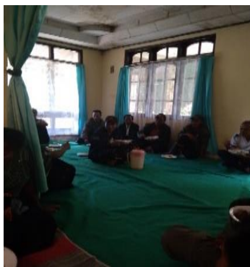
Gambar 3. kegiatan nalo di rumah adat

Budaya masyarakat merupakan lingkungan sekitar anak yang sangat berpengaruh juga terhadap perkembangan anak. Dengan pengaruh budaya yang baik maka nilai-nilai yang tertanam kepada anak akan baik pula. Faktor budaya juga memberikan dampak yang besar untuk anak usia dini yang sedang berkembang karena dengan budaya anak belajar dan dengan budaya pula anak berkembang. Anak-anak akan terkondisikan oleh rangsangan-rangsangan yang diberikan oleh budaya (Carol, Sharon, & Renee, 2010). Hal ini sejalan dengan Fono, Fridani, & Meilani, (2019) mengatakan bahwa budaya setempat dapat mempengaruhi tingkah laku anak, apalagi budaya suku Belu di kabupaten Ngada yang memiliki banyak ritual adat yang di dalamnya terkandung makna dan nilai kehidupan bagi perkembangan anak usia dini.