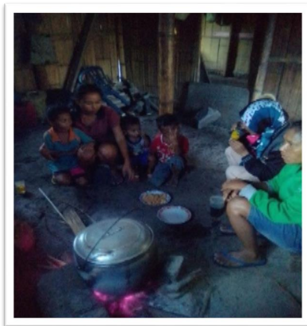
Gambar 6. Ramah dengan tamu dan menerimanya dengan tulus

Dengan pemberian contoh keramah-tamahan, keakraban, sopan santun, saling menghormati dan saling menghormati terciptalah pola masyarakat yang terbiasa dengan hal seperti itu sehingga tanpa mereka sadari sudah memberikan pelajaran atau teladan bagi siapa saja yang melihat, termasuk anak. Dengan sifat bawaan anak yang suka meniru pasti akan belajar dari apa yang ia lihat dan dari apa yang ia dengar. Orang tua atau orang dewasa merupakan seorang model yang utama bagi anak mereka dalam bersosialisasi (Carol et al., 2010), sehingga dengan lingkungan orang dewasa yang memiliki sosialisasi tinggi maka perkembangan sosial anak juga akan tinggi.