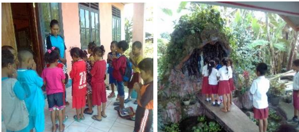
Gambar 5. apikasi dari nilai budaya (karakter religius)

Filosofi yang diajarkan dari syair ini diaplikasikan melalui tindakan anak yaitu rajin beribadah dengan berdoa kepada Tuhan setiap awal dan akhir kegiatan baik di rumah, sekolah maupun lingkungan masyarakat.