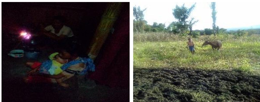
Gambar 8. anak bertanggung jawab menjalankan tugas yang diberikan oleh orang tua

Salah satu bentuk positif untuk mengembangkan kemampuan anak adalah menyelesaikan tugas (French, 20017). Dengan pemberian tugas kepada anak sesuai dengan usia anak maka anak akan belajar bagaimana menyelesaikan tugas tersebut dan secara tidak langsung hal tersebut mengajarkan kepada anak untuk bertanggung jawab. Sesuai dengan ajaran suku Belu yang sering dilantunkan dalam syair Pata Dela yang berbunyi "Dua wi uma bodha ne'e su'a, nuka wi sa'o ne'e ranga da baka ghako (pergi ke kebun bawa su'a, pulang ke rumah bawa makan babi). Makna dari syair di atas adalah. Bekerja keras dan bersungguh-sungguh. Selain itu lirik lain dalam syair yang memiliki makna setia anak harus bertanggung jawab yaitu Ngo ma'e bari kadhi (bekerja jangan langgar).