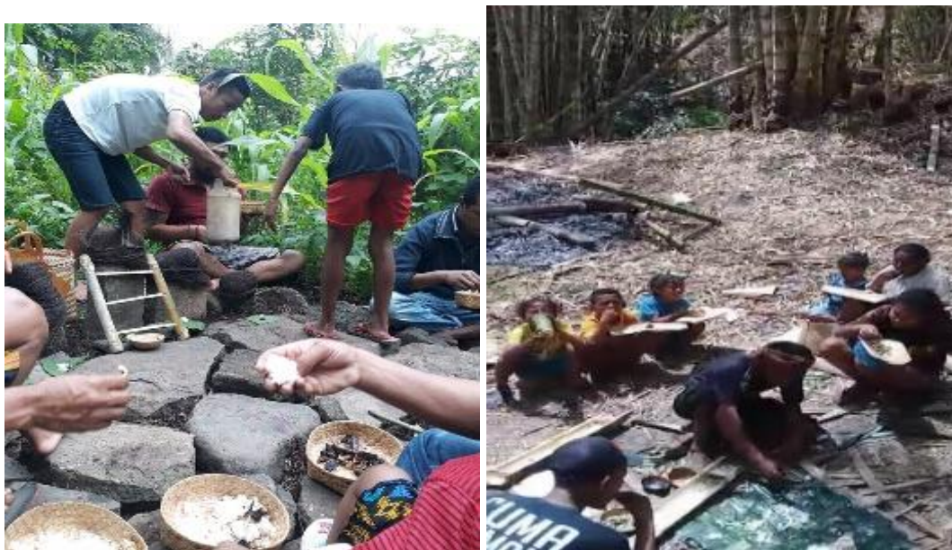
Gambar 2. kegiatan nalo yang dilakukan di loka

Budaya masyarakat merupakan lingkungan sekitar anak yang sangat berpengaruh juga terhadap perkembangan anak. Dengan pengaruh budaya yang baik maka nilai-nilai yang tertanam kepada anak akan baik pula. Faktor budaya juga memberikan dampak yang besar untuk anak usia dini yang sedang berkembang karena dengan budaya anak belajar dan dengan budaya pula anak berkembang. Anak-anak akan terkondisikan oleh rangsangan-rangsangan yang diberikan oleh budaya (Carol, Sharon, & Renee, 2010). Hal ini sejalan dengan Fono, Fridani, & Meilani, (2019) mengatakan bahwa budaya setempat dapat mempengaruhi tingkah laku anak, apalagi budaya suku Belu di kabupaten Ngada yang memiliki banyak ritual adat yang di dalamnya terkandung makna dan nilai kehidupan bagi perkembangan anak usia dini.