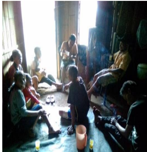
Gambar 4. nalo bersama sanak keluarga di rumah

tercermin dari budaya nalo. Ini diakibatkan faktor pembiasaan, pengertian, nilai filosofi budaya mempengaruhi terbentuknya karakter baik dalam budaya nalo.