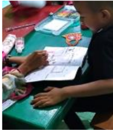
Gambar 4. Anak menunjukkan kemampuan membaca permulaan

Peneliti dapat menjelaskan kemampuan membaca permulaan anak Kelompok B di RA ICP Nurul Ulum Bojonegoro (Gambar 4) menjadi beberapa penjelasan dari data yang sudah dikumpulkan dan dianalisis. Pertama, menurut guru dan kepala sekolah anak telah sanggup mengenal huruf abjad a-z. Kemampuan anak kelompok B telah mengenal dan membaca abjad dengan baik, hal ini terlihat dari bacaan yang mereka pilih seperti buku bacaan paten. Namun masih terdapat anak pada kelompok ini yang masih menggunakan buku vocal pada kegiatan membaca permulaan. Kedua, kemampuan membaca suku kata yang anak miliki juga tergolong baik, berdasarkan hasil observasi hanya terdapat satu orang anak yang membaca dengan buku bacaan berisikan suku kata, anak yang lain telah menggunakan buku vocal dan paten. Ketiga, kemampuan membaca permulaan anak kelompok B sudah mencapai tahap membaca kata. Kemudian keempat yakni dalam membaca kalimat anak sudah cukup baik, membaca kalimat yang anak lakukan pada kemampuan ini adalah membaca kalimat sederhana yang terdiri dari tiga kata. Kelima, terdapat beberapa anak yang telah sampai kepada tahap membaca. Hal ini ditunjukkan dengan kemampuan anak dalam membaca buku cerita dalam bahasa Indonesia. Sedangkan yang keenam, beberapa anak juga telah menunjukkan kemampuan membaca permulaan dalam kegiatan membaca buku berbahasa Inggris, meskipun masih terdapat beberapa anak yang membaca bunyi kata tersebut secara kurang tepat.