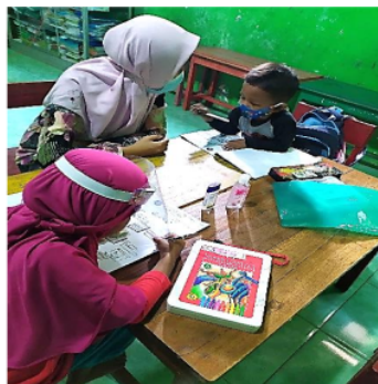
Gambar 2. Metode yang diterapkan oleh guru

4 Metode Membaca dalam Mengembangkan Kemampuan Membaca Permulaan Anak Usia Dini Kelompok B di RA ICP Nurul Ulum Bojonegoro