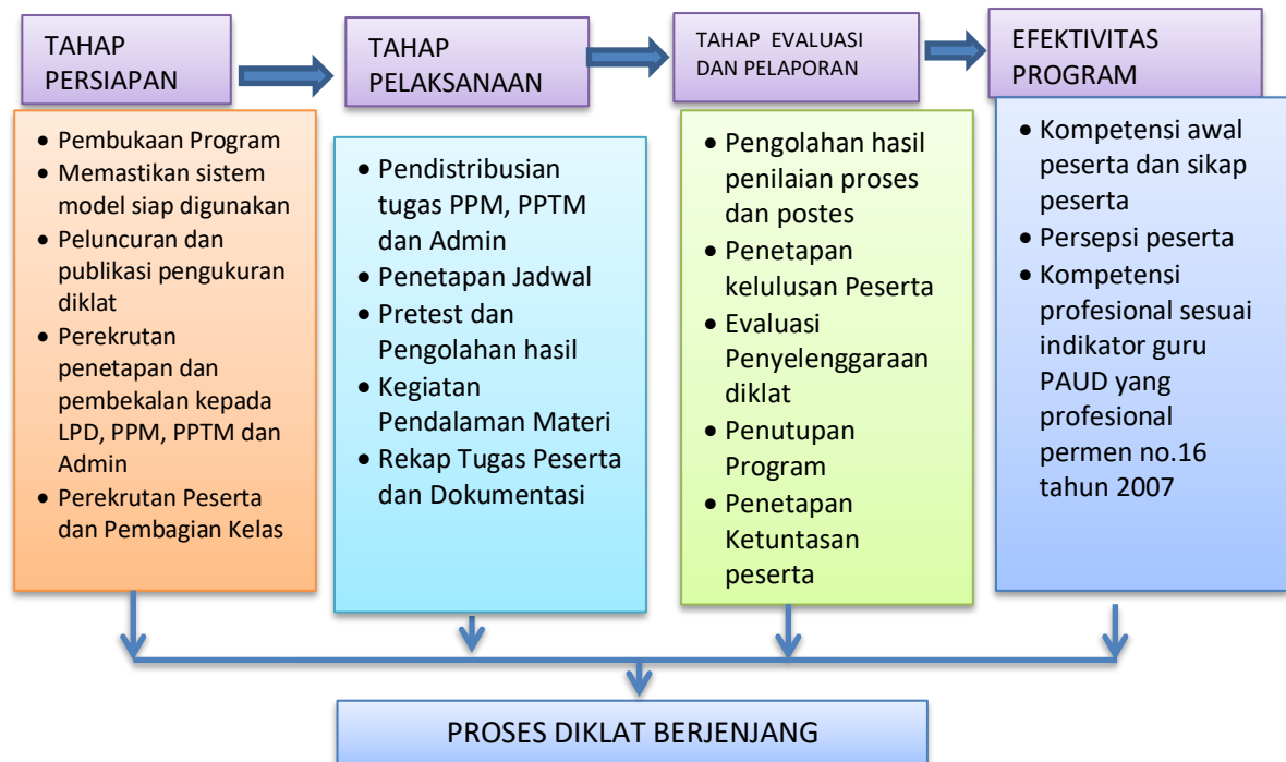
Gambar 2. Alur Efektivitas Program Diklat Berjenjang tingkat dasar guru PAUD

Efektivitas Diklat dievaluasi berdasarkan waktu melalui tiga tahapan yaitu tahap persiapan, tahap pelaksanaan dan tahap evaluasi, Alur program Diklat berjenjang tingkat dasar dapat dilihat pada gambar 2 (Nasruddin et al., 2022).