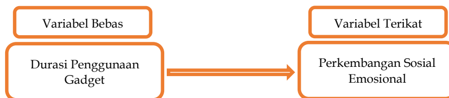
Gambar 1. Rancangan Penelitian

Penelitian ini menggunakan instrument yang dirumuskan berdasarkan definisi operasional terkait durasi bermain gadget dan perkembangan sosial emosional anak usia 4 tahun yang sebelumnya sudah di uji validitas terlebih dahulu, kemudian di uji reliabilitas menggunakan Alpha Cronbach 5% atau (0,05). Jika nilai Alpha Cronbach > r table (0,468), maka dapat disimpulkan angket tersebut reliabel atau dapat dipercaya. Hasil dari uji reliabilitas variabel perkembangan sosial emosional mendapatkan nilai 0,920 yang berarti > r table (0,468), dan untuk uji reliabilitas durasi penggunaan gadget mendapatkan nilai 1.000 yang berarti > r tabel (0,468), maka dapat disimpulkan angket untuk variabel dependent dan independent diatas reliabel dan dapat dipercaya.