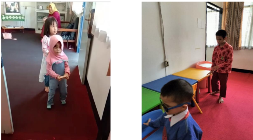
Gambar 2. Anak tunanetra yang sedang bergerak untuk bersembunyi

Kemampuan sosial emosi dapat mempengaruhi keberanian bergerak pada anak tunanetra usia dini maka permainan yang dapat meningkatkan kemampuan sosial emosi tentu akan juga mempengaruhi keterampilan orientasi dan mobilitasnya. Kesiapan emosional dan social akan mendorong anak untuk tertarik lebih banyak ada lingkungan sehingga mereka terdorong melakukan berbagai hal terkait aktivitas di lingkungan sosial. Permainan petak umpet dianggap menjadi salah satu permainan yang dapat mempengaruhi sosial emosi anak, hal ini sejalan dengan penelitian sebelumnya oleh (Hananta & Mas'udah, 2015) menunjukkan bahwa permainan petak umpet yang dilaksanakan pada anak TK di kota Mojokerta dapat meningkatkan kemampuan sosial emosional anak. Gambaran kegiatan anak memainkan petak umpet disajikan pada gambar 2.