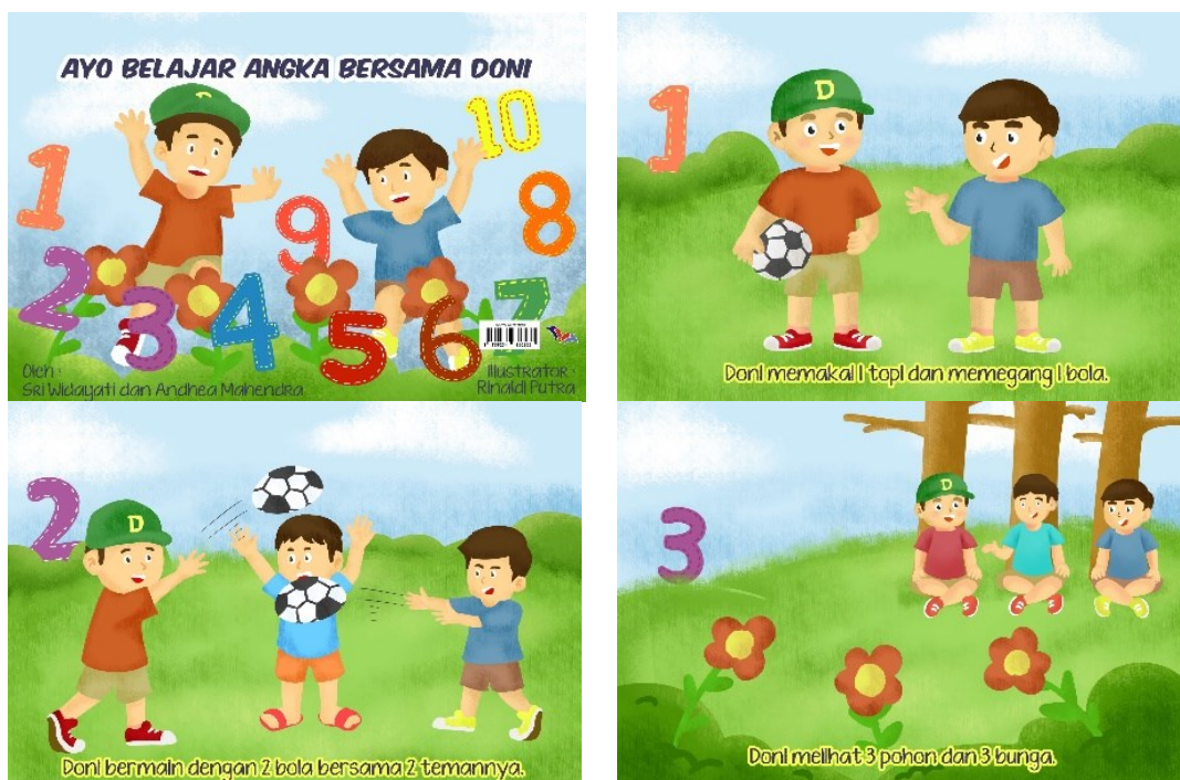
Gambar 2. Buku Cerita Big Book Kalender Meja