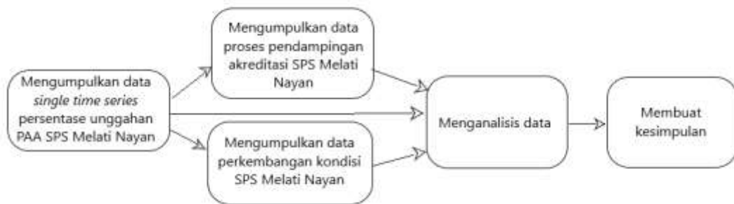
Gambar 1. Langkah-Langkah Penelitian

Aktivitas-aktivitas pendampingan akreditasi terhadap SPS Melati Nayan dilakukan sebelum dan selama lembaga tersebut memulai tahap pertama akreditasi. Pendampingan dilakukan oleh seorang asesor yang dibantu oleh seorang sekretaris. SPS Melati Nayan merupakan salah satu dari 22 lembaga PAUD yang mengikuti pendampingan dalam kelompok pendampingan ini. Data tentang aktivitas pendampingan ini diperoleh melalui wawancara dengan pendamping, kepala SPS Melati Nayan, dan pendidik SPS Melati Nayan yang melengkapi dan mengunggah dokumen-dokumen PPA dalam akreditasi tahap pertama. Wawancara dengan pendamping dilakukan pada hari Kamis 8 Desember 2022 pukul 07.30 – 08.00 WIB di PAUD KB Nurul Ilmi Jetis Argomulyo Cangkringan Sleman DIY sedangkan wawancara dengan Kepala SPS Melati Nayan pada hari Senin 2 Januari 2023 pukul 14.30 – 15.00 WIB di SPS Melati Nayan dan wawancara dengan seorang pendidik SPS Melati Nayan yang menangani akreditasi hari Senin 2 Januari 2023 pukul 15.00 – 15.30 WIB di rumahnya di Nayan Maguwoharjo Depok Sleman DIY. Langkah penelitian disajikan dengan bagan pada gambar 1.