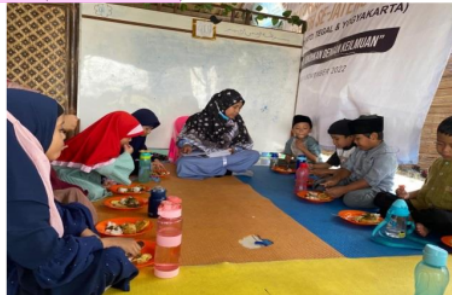
Gambar 4. Kegiatan Makan di kelas 1A Kuttab Awal

anak untuk saling berbagi. Kemudian anak diminta untuk tertib menunggu antrian mendapatkan giliran. Setelah semua anak mendapatkan makanannya, guru membiasakan anak untuk mengucapkan terimakasih kepada teman yang telah menyediakan makanan mereka pada hari itu. Hal ini mengajarkan kepada anak tentang anjuran nabi yaitu mengucapkan terimakasih apabila menerima sesuatu (Syukroni, 2018). Sebagaimana hadis Nabi yaitu yang artinya "Barang siapa yang dibuatkan kepadanya kebaikan, lalu ia mengatakan kepada pelakunya: "jazakallah khairan (semoga Allah membalasmu dengan kebaikan), maka sungguh ia telah benar-benar meninggikan pujian." (HR. Tirmidzi).