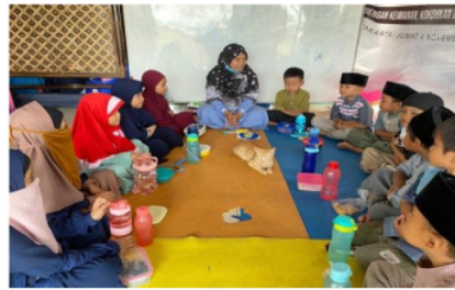
Gambar 3. Kegiatan bercerita islamiyah di kelas 1A Kuttab Awal

Anak dan guru saat melakukan kegiatan bercerita dapat dilihat pada gambar 3. Berdasarkan hasil observasi anak sangat antusias dalam mendengarkan cerita dari guru. Anak duduk dengan sangat tertib dan menyimak cerita dari awal sampai akhir.