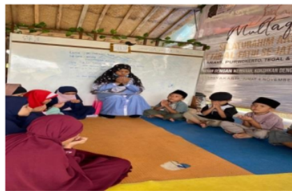
Gambar 5. Kegiatan setelah makan di kelas 1A Kuttab Awal

Kegiatan saat makan dapat dilihat pada gambar 4. Setelah kegiatan makan selesai, kegiatan selanjutnya ialah membaca do'a sesudah makan. Kemudian dilanjutkan dengan bernyanyi lagu tepuk sesudah makan. Dalam lagu ini berisi tentang rasa syukur kepada Allah SWT atas rezeki yang telah diberikan yaitu berupa makanan. Terakhir anak membereskan makanan yang telah selesai dan membuang sampah pada tempatnya. Pembiasaan ini setiap hari diberikan oleh guru agar anak terbiasa bersikap dan mengerti tata cara makan yang baik dan benar.