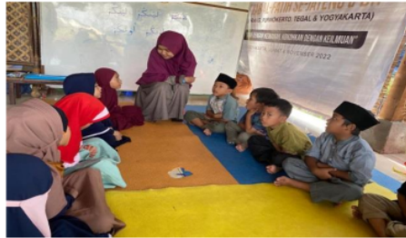
Gambar 2. Kegiatan pembuka bercerita di kelas 1A Kuttub Awal

Kegiatan anak dan guru saat melakukan kegiatan pembuka di kelas sebelum bercerita dapat dilihat pada gambar 2. Berdasarkan hasil observasi terlihat bahwa anak duduk berdesakan, namun guru memberitahukan anak agar berlapang-lapang dalam majelis. Kemudian anak duduk tertib dan mengikuti aturan yang telah diberikan oleh guru. Selanjutnya terdapat satu orang anak yang menjawab salam namun tidak melihat ke wajah gurunya (yang memberikan salam), namun guru langsung menegur anak tersebut untuk kembali menjawab salam (Observasi peneliti pada saat penelitian).