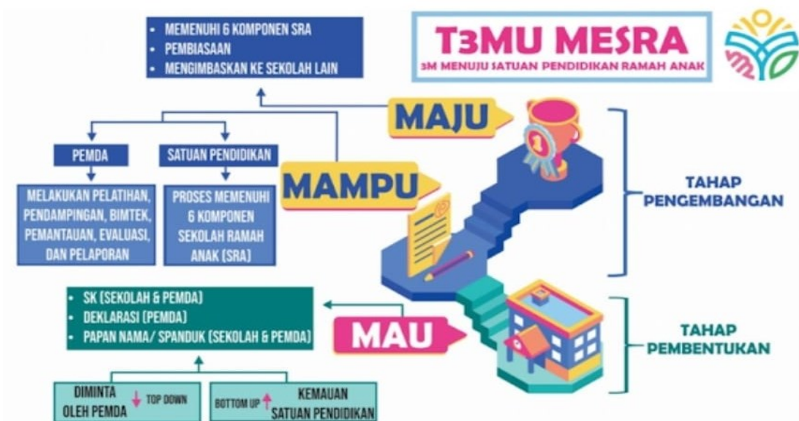
Gambar 2: Bagan Komitmen Sekolah Ramah Anak

Pelaksanaan SRA tingkat PAUD saat ini jumlahnya masih kurang diminati. Hal ini ditunjukkan bahwa sekolah yang tergolong dalam ramah anak masih sedikit. Sebagai parameter SRA yang disampaikan oleh UNICEF adalah sekolah yang mampu memenuhi 5 aspek mutu, yaitu: 1) Siswa berkualitas, sehat, cukup makan, siap belajar dan didukung oleh keluarga dan masyarakat. 2) Kurikulum sekolah serta materi yang mendukung pengembangan literasi, 3) Numerasi, ilmu pengetahuan, etika dan kecakapan hidup, 4) Keutamaan dalam PBM yang berpusat pada anak dengan basis dasar keterampilan dan teknologi, 5) Lingkungan belajar dalam pelaksanaan praktik yang mumpuni (ruang kelas, air, saluran pembuangan) dan layanan (keamanan, kesehatan fisik dan psikososial), dan 6) Kualitas hasil, pembelajaran, yang mengutamakan etika dan keahlian; pemberian nilai yang tepat di tingkat dasar dan tingkat nasional. Tahapan pelaksanaan program SRA dapat dilihat pada bagan pada gambar 1.