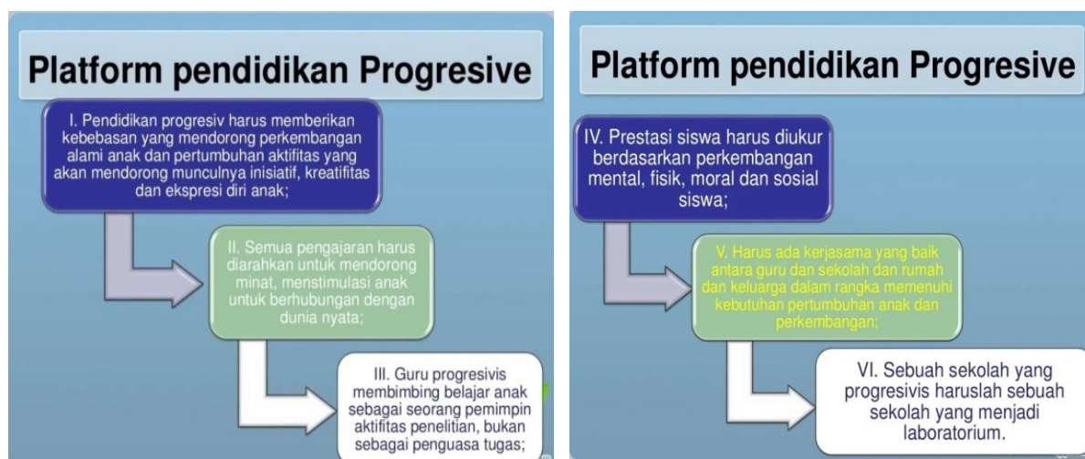
Gambar 3: Platform Pendidikan Progressive John Dewey

Dari analisis yang dilakukan penulis, maka diambil kesimpulan bahwa faktor terpenting yang dapat mensukseskan program ini adalah pihak sekolah, orang tua murid, siswa, serta masyarakat sekitar lingkungan sekolah (Ndari & Chandrawaty., 2019). Anak usia dini memiliki batasan usia tertentu dengan cirinya yang unik, kemudian berkembang pada tahap pendidikan selanjutnya dalam proses perkembangan yang sangat cepat dan pesat. Masa perkembangan anak usia dini merupakan masa keemasan atau golden age, yang mengalami periode tercepat dalam perkembangan yang pesat dimulai dari periode prenatal, yaitu dari dalam Rahim (Ariyanti, 2016). Analisis penulis tentang pelaksanaan sekolah ramah anak berdasarkan perspektif progresiv dewey dapat dilihat pada platform pada gambar 3.