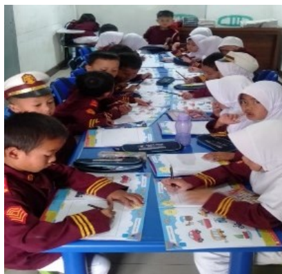
Gambar 3. Kegiatan Menggambar dan Mewarnai Anak

Kegiatan Menggambar bebas merupakan salah satu aktivitas memberikan keleluasaan dan kesempatan kepada anak untuk menggambar apapun yang mereka inginkan, tanpa dipaksa, sehingga mereka bisa bersenang-senang. (Veryawan et al., 2020). Menggambar bebas memiliki dampak yang baik bagi anak, dimana anak bebas menuangkan perasaan serta ide-ide anak dengan leluasa dan mampu menciptakan perasaan yang menyenangkan bagi anak-anak. Menurut Ismayaini yang dikutip oleh Pertiwi & Mayar menggambar bebas yaitu kegiatan yang dapat diberikan oleh guru untuk memberikan kebebasan kepada anak-anak untuk menciptakan karya gambar apa saja yang mereka inginkan anak dan sesuai dengan ide anak sehingga memberikan kepuasan dan kesenangan dalam diri anak (Pertiwi & Mayar, 2020).