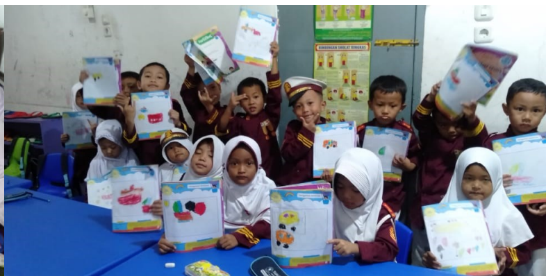
Gambar 4. Hasil Menggambar dan Mewarnai Anak Tema Kendaraan

Pada tahapan yang ke empat yaitu anak dibebaskan untuk menggunakan alat yang mereka sukai dan anak dipersilahkan untuk mewarnai hasil gambarannya sesuai dengan imajinasi anak masing-masing. Berdasarkan hasil wawancara yang telah dilakukan, guru membebaskan peserta didik untuk menggunakan pensil warna atau krayon serta guru juga membebaskan anak untuk mewarnai hasil gambarannya sesuai dengan imajinasi anak, anak-anak dibebaskan untuk mengeksplor dunia mereka tanpa ada paksaan dari pihak guru-guru di sana. Dengan demikian, guru memiliki tujuan agar anak dapat menggali potensi yang dimiliki masing-masing serta dapat membantu anak mengenal banyak warna dan bentuk dari alat dan gambar yang mereka gunakan atau buat. Anak-anak diberikan kebebasan untuk