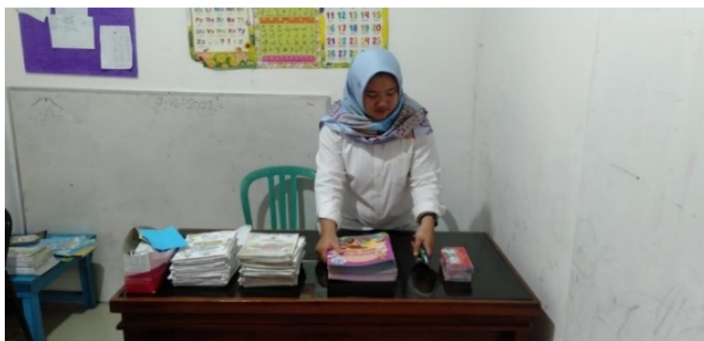
Gambar 2. Guru Menyiapkan Alat & Bahan

Pada tahapan kedua yaitu guru menjelaskan tema saat ini, dari hasil observasi serta wawancara yang sudah dilaksanakan pada guru kelas bahwa. Setelah memasuki waktu belajar mengajar guru memberitahu terlebih dahulu kepada anak-anak tentang apa saja pelajaran yang akan dilakukan hari ini. Mulai dari tema sampai kegiatan-kegiatan yang akan dilakukan sampai akhir, hal ini dilakukan agar anak paham dan mengetahui apa yang disampaikan oleh guru serta bertujuan untuk mengenalkan hal-hal baru kepada anak sesuai tema pembelajaran dan bertujuan juga untuk mengasah keaktifan siswa dengan sedikit memberikan beberapa pertanyaan sederhana kepada anak-anak. Sebelum kegiatan belajar mengajar berlangsung guru terlebih dahulu menetapkan tujuan dan tema pembelajaran, selanjutnya guru menjelaskan dan memberitahu kepada anak tentang tema pembelajaran hari ini serta memberikan media pembelajaran sebagai penunjang kegiatan belajar yang akan dipergunakan hari ini. Tahap selanjutnya yaitu anak-anak diberikan kesempatan untuk menggambar bebas tetapi harus sesuai dengan tema hari ini dengan menggunakan media