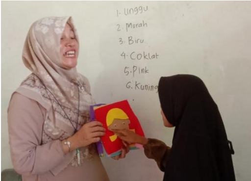
Gambar 1. Guru Menentukan tema yang sesuai dengan kebutuhan

tunarungu. Langkah pertama yang dilakukan adalah guru atau pembimbing menentukan tema yang nantinya akan diajarkan kepada anak didik tunarungu melalui media Busy Book karena pada dasarnya anak yang memiliki kebutuhan khusus juga memiliki tingkat kebutuhan yang berbeda-beda. Menentukan tema yang sesuai dengan kebutuhan mereka sangatlah penting sehingga proses pembelajaran akan menjadi efektif.