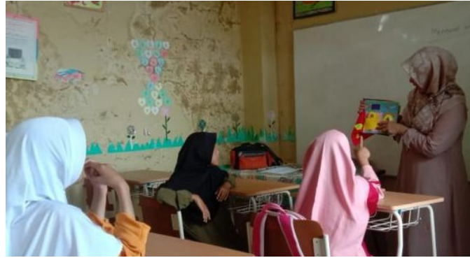
Gambar 2. Guru melakukan tanya jawab kepada siswa

Langkah kedua yang dilakukan adalah menjelaskan apa saja materi yang ada dalam media Busy Book yang sesuai tema. Beberapa tema yang akan dilakukan dalam proses pembelajaran dalam meningkatkan kemampuan membaca permulaan pada anak tunarungu seperti pengenalan huruf, pengenalan kata dan belajar membaca kalimat sederhana. Dan di dalam tema-tema tersebut terdapat lagi beberapa kegiatan interaksi yang dilakukan guru kepada anak didik tunarungu. Sehingga akan ada banyak pilihan aktivitas yang dapat dilakukan seorang pembimbing yang disesuaikan dengan kemampuan dan keterbatasan yang dimiliki anak didik. Pelaksanaan langkah kedua digambarkan pada gambar 2.