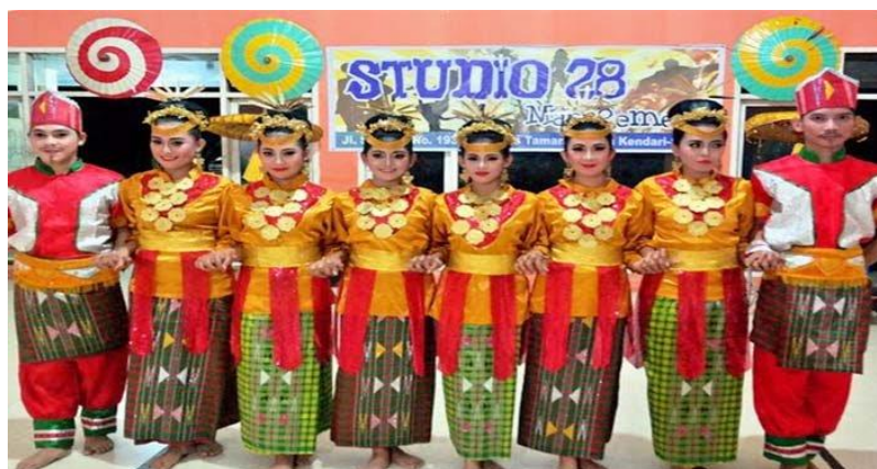
Gambar 2 Baju Adat Suku Tolaki (Dokumentasi Sanggar Studio 28 Kota kendari)

Busana adat Suku Tolaki yang disebutkan pada petikan di atas, sebagaimana terlihat dalam gambar di bawah ini: