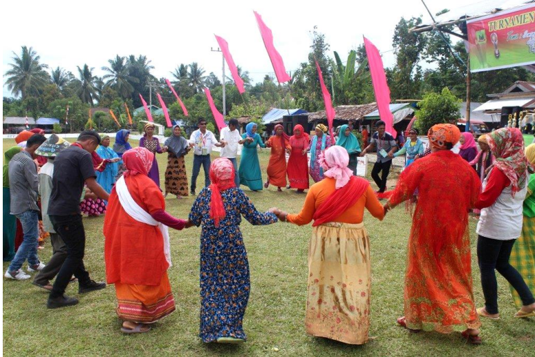
Gambar 1 Bentuk Lingkaran dan Posisi Tangan Peserta Tarian Lulo

segala kemungkinan perubahan dan inovasi atas tarian ini. Seorang tokoh masyarakat memberikan penjelasan mengenai tatakrama dan etika dalam menarikan tarian Lulo . Sebagai sebuah budaya, tari lulo berfungsi sebagai identitas, pengikat, kekuatan penggerak atau pengubah, pembentuk nilai tambah, pola perilaku, warisan dan lain-lain. Berdasarkan penjelasan seorang Tokoh Adat Masyarakat Tolaki diketahui jika filosofi tarian lulo adalah persahabatan dan mempererat tali persaudaraan. Tarian lulo dilakukan dengan posisi saling bergandengan tangan dan membentuk sebuah lingkaran. Maknanya mencerminkan bahwa masyarakat Suku Tolaki sangat mencintai kedamaian dan menomorsatukan persahabatan dan persatuan dalam bingkai kehidupan nusantara. Disebutkan sebelumnya jika melakukan tarian lulo yaitu dengan posisi tangan saling bergandengan dan pesertanya membentuk sebuah lingkaran. Posisi tersebut sebagaimana terlihat pada gambar di bawah ini: