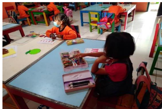
Gambar. 3. Proses kegiatan menggambar