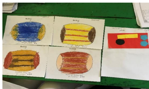
Gambar. 5. Hasil Menggambar