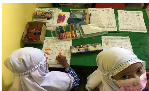
Gambar. 4. Proses kegiatan menggambar