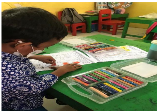
Gambar. 2. Proses kegiatan menggambar