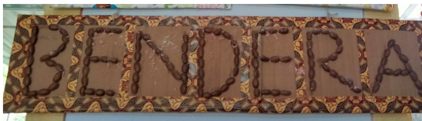
Gambar 3: Hasil Karya Kegiatan Menempel