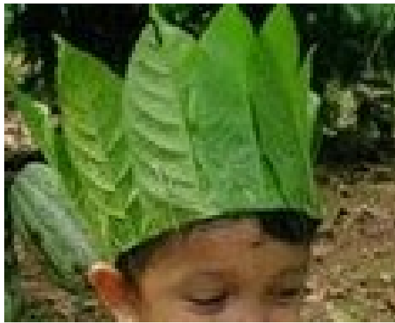
Gambar 4: Hasil Karya Kegiatan Membuat Mahkota

Penggunaan daun kopi basah digunakan untuk membuat mahkota daun dengan dibantu ranting yang dipotong-potong berguna untuk menyambungkan daun selanjutnya untuk membentuk lingkaran. Anak-anak berkreasi membuat mahkota dengan daun kopi dan hasilnya mahkota tersebut bervariasi dan bermacam-macam bentuknya (gambar 4). Selain biji-bijian, pengenalan kopi dapat melalui daun kopi. Berdasarkan hasil wawancara kepada salah satu guru inisial A dapat disimpulkan bahwa anak-anak ketika ada di kegiatan membuat mahkota anak-anak belajar tentang bentuk daun utamanya daun kopi. Anak-anak juga belajar melipat bahkan menggunting daun agar sesuai dengan mahkota yang ingin dibuat.