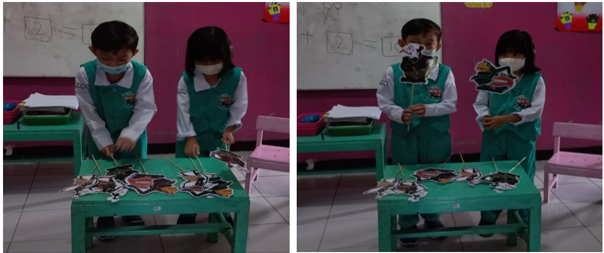
Gambar 7. Anak Menceritakan tokoh Punokawan