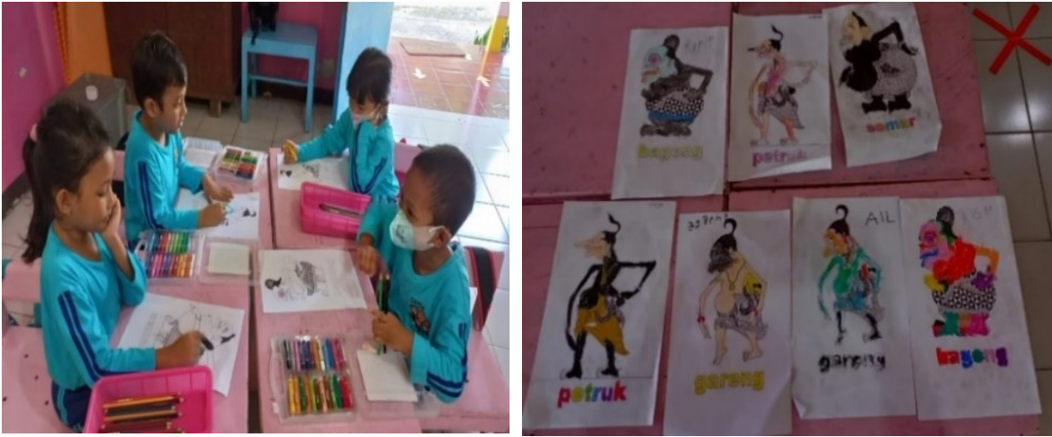
Gambar 4. Anak Mewarnai Gambar Tokoh Penakawan