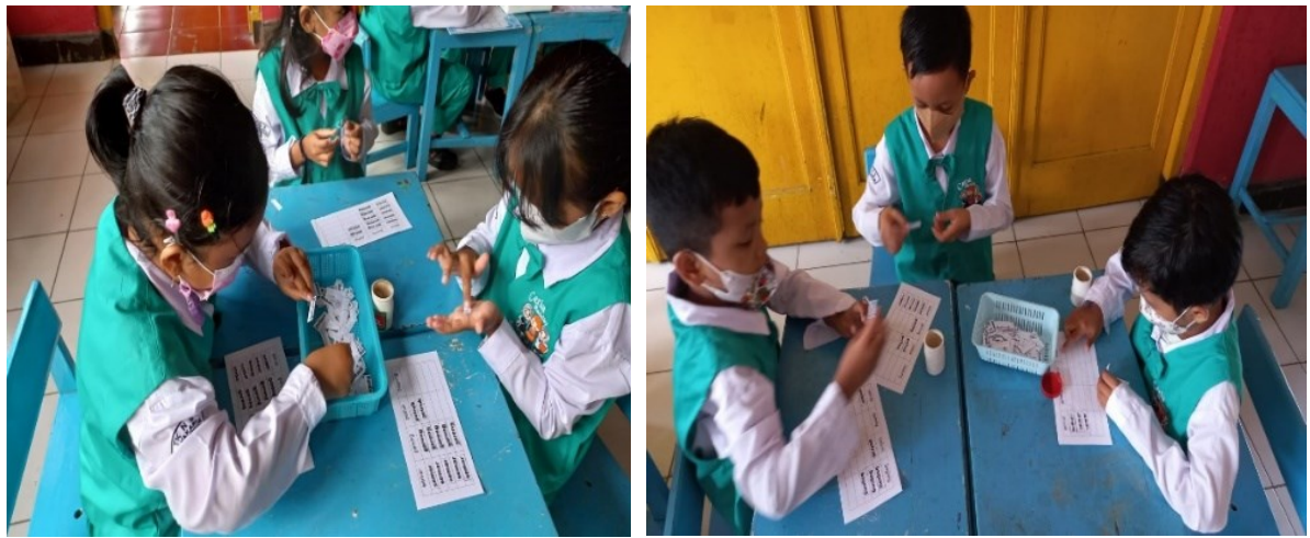
Gambar 8. Anak Mengelompokkan kartu nama : semar, gareng, petruk, bagong