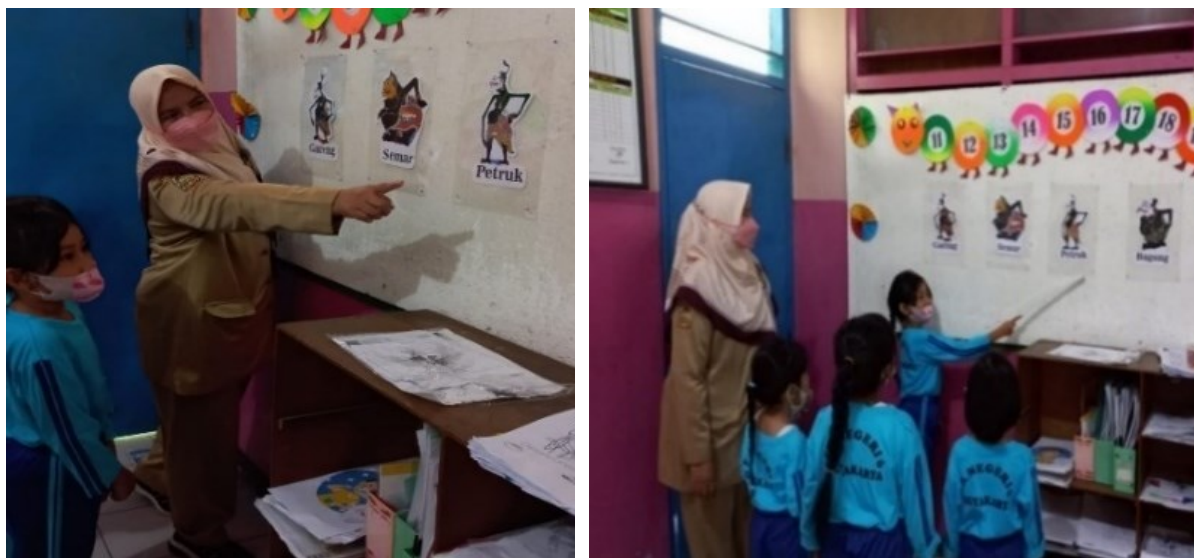
Gambar 3. Guru Mengenalkan Tokoh Wayang Punokawan

Kegiatan pembelajaran seni dengan wayang Punokawan dilakukan secara bertahap dari mulai pengenalan hingga memainkan wayang. Beberapa kegiatan dan pembelajaran seni yang telah diimplementasi di TK Negeri 6 Yogyakarta disajikan pada gambar 3 sampai dengan 11 dan tabel 1 (lampiran).