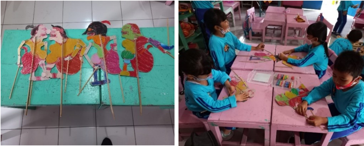
Gambar 10. Anak Melukis bentuk wayang Punokawan