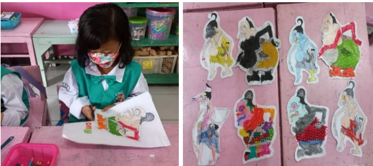
Gambar 6. Anak Menggunting Gambar Tokoh Punokawan