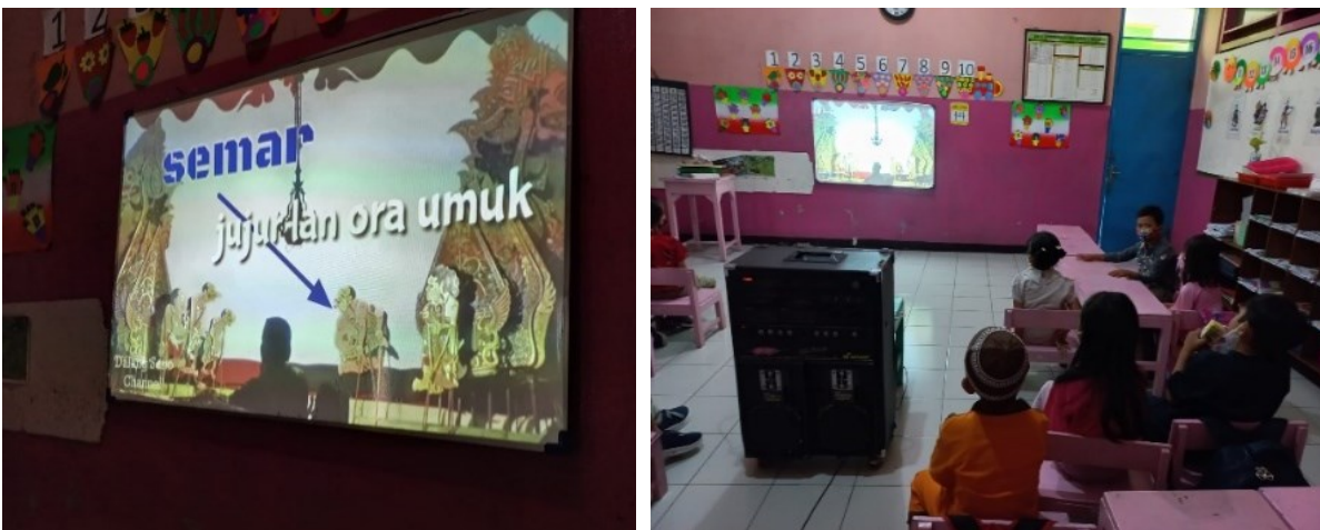
Gambar 5. Anak Melihat Video sifat dan Ciri-ciri Tokoh Punokawan