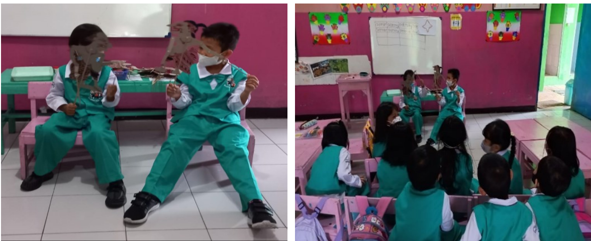
Gambar 11. Anak Memainkan Wayang Punokawan