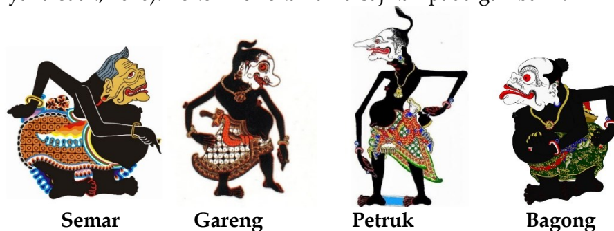
Gambar 1. Tokoh Punokawan

Punokawan menurut Purwadi (2014: 124), berasal dari kata pana = cerdik, jelas, terang atau cermat dalam pengamatan, sedang kata kawan = teman (kawan). Jadi panakawan berarti teman (pamong) yang sangat cerdik, dapat dipercaya serta mempunyai pandangan yang luas serta pengamatan yang tajam dan cermat, dalam istilah sastra Jawa tanggap ing sasmita lan limpad pasang ing grahita (Fattahul Alim, 2018). Sedangkan menurut Ayuna (2017), Punokawan merupakan tokoh wayang yang mengisahkan empat orang tokoh yang terkenal di tanah Jawa, yaitu Semar Badranaya, Nala Gareng, Petruk Kanthong Bolong, dan Bagong. Kata Punokawan dapat diartikan sebagai kawan yang menjadi pengiring. Tokoh wayang Punokawan diciptakan oleh seorang pujangga dimana tokoh wayang punakawan pertama kali muncul dalam karya sastra gatot kaca karangan Empu Panuluh pada zaman kerajaan Kediri (Yanwastika Ariyana et al., 2020). Tokoh Punokawan disajikan pada gambar 1.