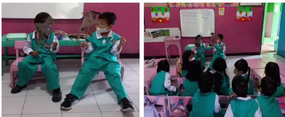
Gambar 11. Anak Memainkan Wayang Punokawan