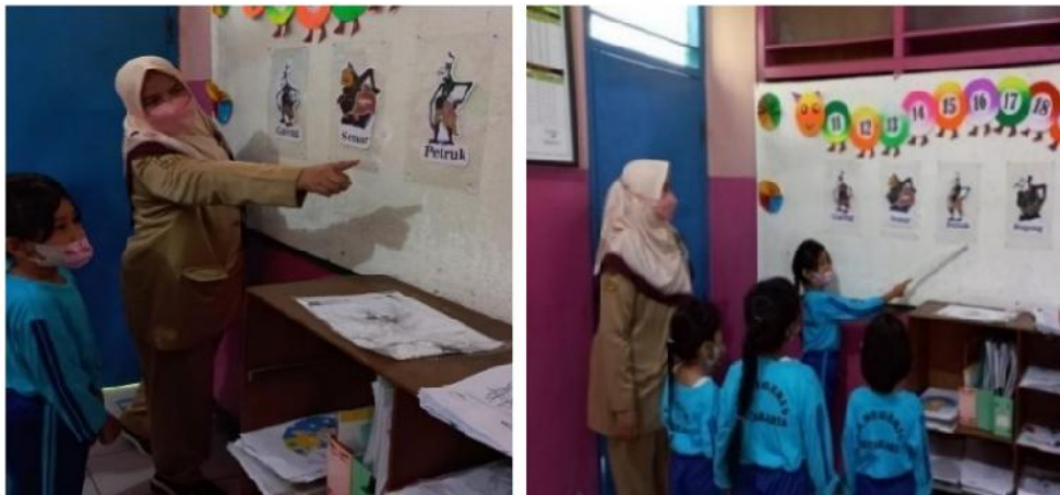
Gambar 3. Guru Mengenalkan Tokoh Wayang Punokawan

Kegiatan pembelajaran seni dengan wayang Punokawan dilakukan secara bertahap dari mulai pengenalan hingga memainkan wayang. Beberapa kegiatan dan pembelajaran seni yang telah diimplementasi di TK Negeri 6 Yogyakarta disajikan pada gambar 3 sampai dengan 11 dan tabel 1 (lampiran).