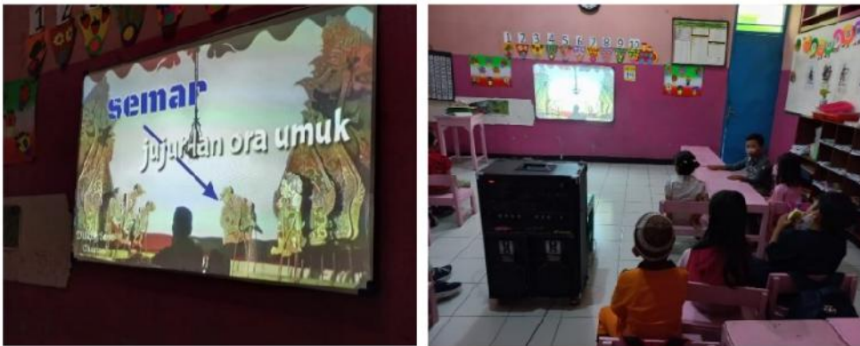
Gambar 5. Anak Melihat Video sifat dan Ciri-ciri Tokoh Punokawan