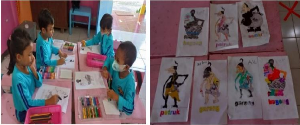
Gambar 4. Anak Mewarnai Gambar Tokoh Penakawan