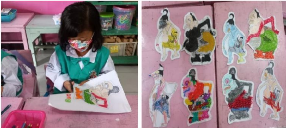
Gambar 6. Anak Menggunting Gambar Tokoh Punokawan