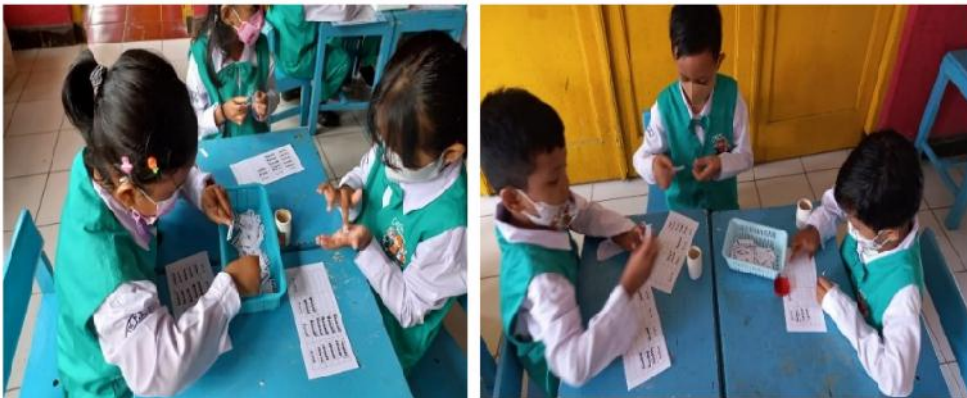
Gambar 8. Anak Mengelompokkan kartu nama : semar, gareng, petruk, bagong