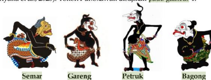
Gambar 1. Tokoh Punokawan

Punokawan menurut Purwadi (2014: 124), berasal dari kata pana = cerdas, jelas, terang atau cermat dalam pengamatan, sedang kata kawan = teman (kawan). Jadi panakawan berarti teman (pamong) yang sangat cerdas, dapat dipercaya serta mempunyai pandangan yang luas serta pengamatan yang tajam dan cermat. dalam istilah sastra Jawa tanggap ing sasmita lan pad pasang ing galita (Fattahul Alim, 2018). Sedangkan menurut Ayuna (2017), Punokawan merupakan tokoh wayang yang mengisahkan empat orang tokoh yang terkenal di tanah Jawa, yaitu Semar Badranaya, Nala Gareng, Petruk Kanthong Bolong, dan Bagong. Kata Punokawan dapat diartikan sebagai kawan yang menjadi pengiring. Tokoh wayang Punokawan diciptakan oleh seorang pujangga dimana tokoh wayang punakawan pertama kali muncul dalam karya sastra gatot kaca karangan Empu Panuluh di zaman kerajaan Kediri (Yanwastika Ariyana et al., 2020). Tokoh Punokawan disajikan pada gambar 1.