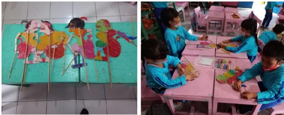
Gambar 10. Anak Melukis bentuk wayang Punokawan