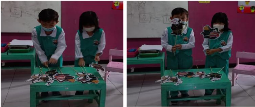
Gambar 7. Anak Menceritakan tokoh Punokawan