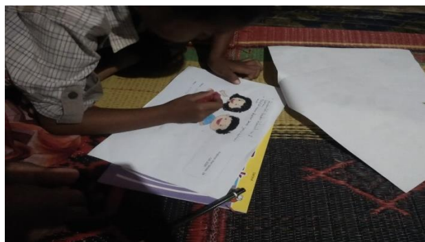
Gambar 1. Lembar Kerja yang di kerjakan oleh anak

Pada sistem belajar daring yang menggunakan media video pembelajaran maupun lembar kerja yang dikirim pendidik dalam pelaksanaannya menimbulkan kejenuhan pada anak jika media tersebut kurang dikemas semenarik mungkin. Pada video pembelajaran anak akan merasa jenuh sehingga menimbulkan ketidakmauan anak dalam mengikuti instruksi yang diberikan pendidik bahkan juga tidak mau untuk divideokan maupun di foto. Sedangkan pada pembelajaran sistem luring yang menggunakan lembar kerja, terkadang orang tua kurang memahami perintah pendidik sehingga menyebabkan anak mengalami kesulitan dalam mengerjakan lembar kerja sehingga anak tidak lagi mau mengerjakan sehingga proses belajar mengajar belum terlaksana optimal. Gambaran lembar kerja yang dikerjakan anak dapat dilihat pada gambar 2.