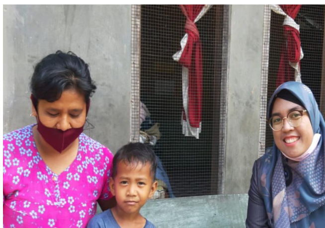
Gambar 4. Kunjungan Guru ke Rumah Anak

Respon yang diberikan oleh orang tua dalam pelaksanaan sistem belajar daring dan luring ini beragam. Ada yang menanggapi secara positif dan secara negatif bahkan ada yang tidak memberikan respon sama sekali. Berikut gambaran respon orang tua dapat dilihat pada tabel 1.