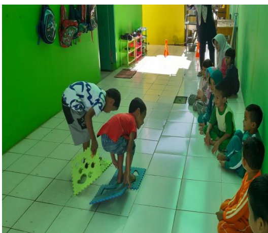
Gambar 3. Aktifitas bersama guru dan teman yang tidak bisa dilaksanakan seperti hari biasa

Dalam hal respon orang tua, pada sistem pembelajaran daring dan luring memiliki beragam reaksi dari orang tua terutama dalam pemanfaatan media Whatsapp Group (WAG) dan lembar kerja anak. Senada dengan Sit & Assingkily (2020) pemanfaatan WAG dapat membantu pendidik untuk tetap menjalankan tugasnya memberi pengajaran pada anak. Harahap, Dimiyati, & Purwanta (2021) dalam memahami penjelasan pendidik terkadang kurang detail dan jelas sehingga membuat pemahaman orang tua berbeda-beda sehingga hasil yang disampaikan kepada anak juga terkadang berbeda pula. Bagi orang tua yang bekerja sesuai dengan hasil penelitian Syahrul & Nurhafizah (2021) banyak orang tua yang tidak bisa mendampingi anaknya belajar dengan berbagai alasan yang mereka kemukakan seperti tidak mampu nya orang tua untuk mendampingi anak belajar disebabkan pekerjaan orang tua yang bekerja sebagai tenaga kesehatan dan sebagainya.