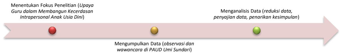
Gambar 1: Alur Metodologi Penelitian