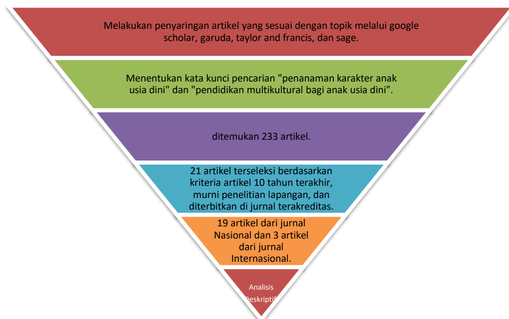
Gambar 1. Tahapan Skema Literature Review

Penelitian ini menggunakan metode literature review dengan pendekatan kualitatif. Metode penelitian yang digunakan adalah literature review atau penelitian kepustakaan, yang didalamnya termasuk alat pencarian literatur misalnya. B. Google Scholar , Garuda , Taylor, dan Francis and Sage . Melakukan pencarian literatur terdiri dari lima langkah, yaitu. H. Mencari literatur yang relevan, mengkaji sumber literatur, mengidentifikasi masalah dan kesenjangan antara teori dan kondisi lapangan, menguraikan pembahasan, membangun kajian diskus (Cahyono et al., 2019).