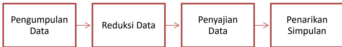
Gambar 1. Langkah-langkah penelitian

Penelitian dilakukan pada Bulan Juni 2021 ketika sekolah telah menerapkan Pembelajaran Tatap Muka Terbatas (PTMT) minimal selama satu bulan. Teknik pengumpulan data yang digunakan adalah wawancara kepada kepala sekolah atau staf kependidikan dan studi dokumentasi berupa empat video persiapan pembelajaran tatap muka terbatas. Informasi tentang penerapan PTMT digali melalui wawancara dengan pertanyaan yang disusun berdasarkan standar PTMT dalam SBK Empat Menteri dan pertanyaan tambahan dari hasil studi dokumentasi yang telah dilakukan sebelum wawancara. Data dianalisis menggunakan teknik analisis domain yaitu menganalisis gambaran objek penelitian secara umum atau di tingkat permukaan, namun relatif utuh tentang objek penelitian tersebut (Putra, 2014). Desain penelitian dapat dilihat pada gambar 1.