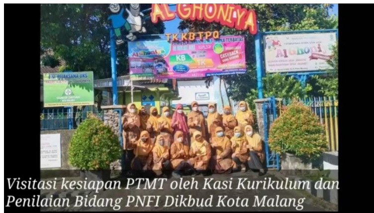
Gambar 2. Monitoring Kesiapan PTMT di TK AG

untuk masa depan mereka, dan masyarakat secara keseluruhan (Clark et al., 2020). Pembelajaran online menjadi solusi ketika angka covid masih sangat tinggi. Kini menuju ke pembelajaran tatap muka, sekolah perlu persiapan yang matang karena pembelajaran tatap muka saat ini harus berdampingan dengan covid.