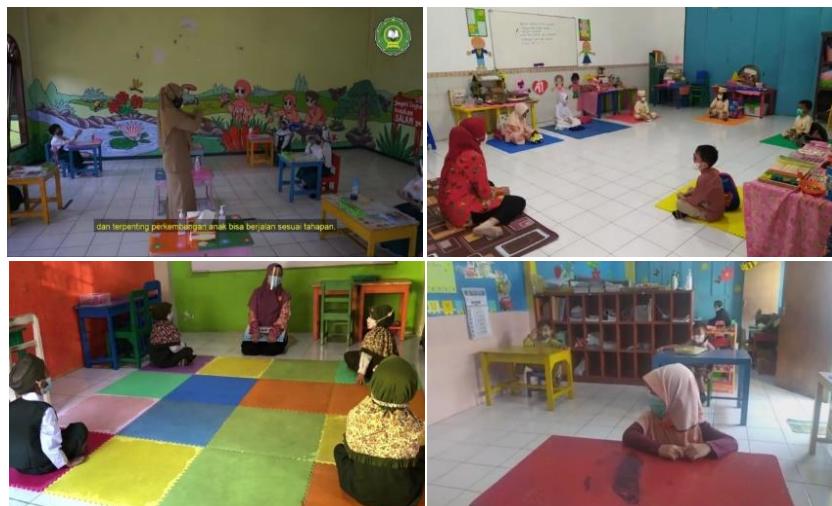
Gambar 7. Kegiatan Belajar Mengajar (KBM) di dalam kelas

KBM di sekolah didesain guru agar mengurangi interaksi antar siswa. Peralatan bermain hanya dipakai satu anak dan tidak bisa bergantian. Tempat duduk anak juga telah diberi nama agar anak tidak berpindah-pindah. Waktu pembelajaran yang dikurangi telah menghilangkan waktu istirahat atau bermain bebas sehingga anak-anak tidak berkerumun untuk bermain bersama. Di TK AF dan AG juga menghilangkan jam makan kue yang biasanya dilakukan setelah kegiatan inti. Siswa juga pulang lebih awal dan memastikan orang tua atau pengasuh menjemput tepat waktu.