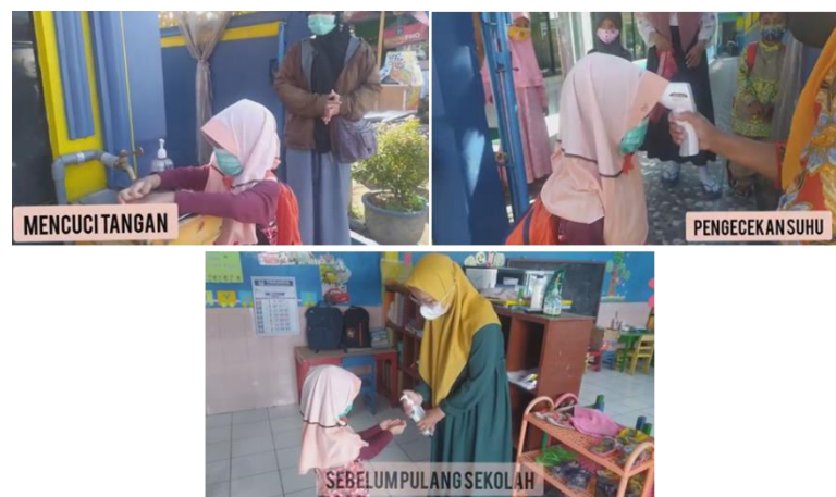
Gambar 6. Protokol kesehatan ketika siswa datang

Tantangan dalam PTMT adalah ketika pelaksanaannya. Penelitian yang dilakukan ketika masa pandemi flu babi beberapa tahun silam menghasilkan temuan tentang jumlah kontak murid ketika masa sekolah rata-rata 18,51 kontak setiap hari sedangkan 9,24 kontak terjadi ketika liburan semester (Eames et al., 2010). Perbedaan jumlah kontak yang signifikan memberi gambaran pada masa pandemi saat ini agar dipersiapkan dan dilaksanakan dengan lebih ketat. Pertimbangan berbagai hal tetap mencoba melaksanakan pembelajaran tatap muka dengan peraturan ketat dan terperinci.