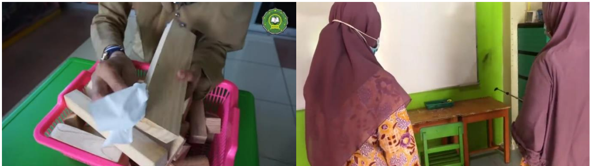
Gambar 5. Membersihkan alat main dan lingkungan belajar anak

Mengingat kebiasaan PTMT masih baru, pihak sekolah dan orang tua masih selalu berusaha dalam beradaptasi. Sekolah membutuhkan arahan dan dukungan yang jelas untuk meningkatkan jam mengajar dan memperkenalkan cara untuk memulihkan kehilangan pembelajaran yang sempat terjadi ketika PJJ (Sparrow et al., 2020). Pihak sekolah berusaha menekan penyebaran virus di lingkungan sekolah, salah satunya dengan selalu membersihkan alat main setelah digunakan dan menyemprotkan disinfektan secara berkala. Berbagai persiapan yang telah disiapkan tidak dapat berhenti begitu saja melainkan perlu terus dievaluasi dan ditingkatkan sesuai dengan kebutuhan. Dukungan dari berbagai kalangan diperlukan untuk mendukung kesuksesan pembelajaran di masa kebiasaan baru. Contohnya seperti orang tua perlu memberikan pengertian tentang kesehatan, kebersihan serta protokol kesehatan kepada anak untuk menguatkan pondasi anak dalam beradaptasi.