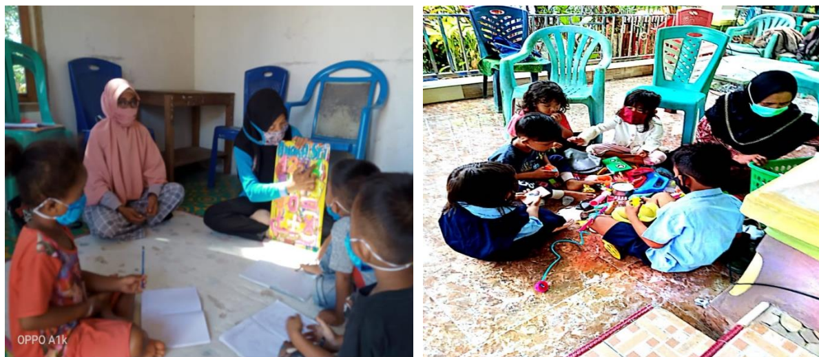
Gambar 3. Pembelajaran Di rumah

pemerintah. Hal ini harus disampaikan kepada anak agar mendisiplinkan diri untuk menjaga kesehatan secara maksimal.