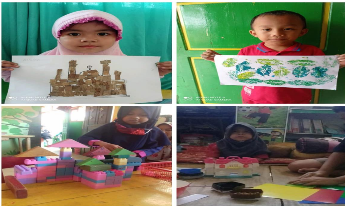
Gambar 2: Kreativitas anak-anak PAUD Al-Fath

Selain itu, guru membuat rancangan kegiatan pembelajaran yang diberikan kepada anak-anak berdasarkan tema yang berlaku dan dekat dengan lingkungan anak, dengan menggunakan sumber belajar yang ada disekitar anak seperti kegiatan masak-masak bersama orang tua, membantu ibu di rumah merapikan tempat tidur, membersihkan dan lain sebagainya. Adapun cara atau langkah-langkah guru dalam merancang pembelajaran dalam menstimulasi anak yaitu guru merancang pembelajaran lebih menekankan pada materi-materi pembiasaan yang ditugaskan kepada anak selama pembelajaran di rumah yang tidak jauh berbeda dengan pembelajaran yang diterapkan di sekolah seperti membiasakan anak untuk selalu tetap menjaga kesehatan yakni mencuci tangan, merapikan alat main setelah digunakan, dan membersihkan perlengkapan makan sendiri. Tugas-tugas pembiasaan yang diberikan guru kepada anak didiknya sesuai dengan kegiatan sehari-hari yang dilakukan anak di rumahnya. Guru memberikan tugas pembiasaan melalui WA grup dalam bentuk teks, audio maupun video. Materi yang diberikan guru selanjutnya didampingi oleh orang tua anak didik dalam mengerjakannya serta mendokumentasikan kegiatan yang dilakukan anak dalam bentuk foto atau video dan hasil karya kemudian dikirimkan ke pada guru sebagai bahan evaluasi atau penilaian perkembangan anak yang nantinya dijadikan sebagai portofolio anak. Gambar 2 merupakan hasil kreativitas anak PAUD Al-Fath dalam berbagai aktivitas.