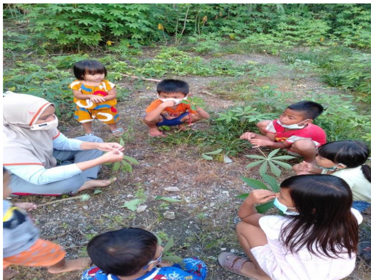
Gambar 4. Pembelajaran berbasis lingkungan

edukatif untuk anak usia dini diantaranya Puzzle, Kartu lambang bilangan, kartu pasangan, puzzle jam, warna, bola suara dan lain-lain