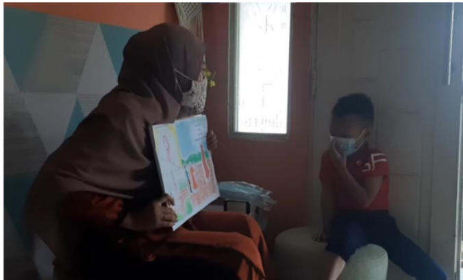
Gambar 5. Penggunaan Big Book Storytelling

Berdasarkan hasil observasi, dari segi per 20 an tampak anak menunjukkan adanya minat untuk mengikuti pelajaran. Dia juga mau menyimak dan mendengarkan informasi yang diberikan oleh guru. Dari segi semangat, anak mau menjawab pertanyaan yang diberikan oleh guru yang menandakan dia cukup antusias dalam menanggapi cerita yang disampaikan. Aspek rasa senang/puas bisa terlihat dari ekspresi anak yang menunjukkan kegembiraan dari awal kegiatan. Terkait penguasaan kosakata yang diberikan, di saat guru 23 mengonfirmasi empat kata yang dikenalkan di awal, anak mampu mengulangi kembali kata-kat 26 tersebut baik dalam bahasa Indonesia maupun bahasa Inggris. Hal ini senada dengan penelitian terdahulu bahwa penggunaan big book storytelling bisa secara efektif mengenalkan literasi dwibahasa bagi anak (Gaya, 2017; Tuerah, 2021). Selain itu, penggunaan flashcard juga bisa membuat anak mudah mengingat kosakata bahasa Indonesia dan Inggris. Sebagaimana yang disarankan oleh Hamidah (2020) dan Yansyah (2017) penggunaan flashcard memang efektif untuk digunakan bagi anak usia dini dalam pengenalan kata dan latihan membaca.