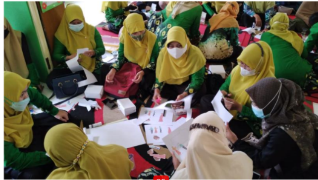
Gambar 2. Guru Membuat Big Book Secara Berkelompok

Big book dalam penelitian ini dibuat dengan menggunakan buku gambar ukuran A3. Pemilihan buku gambar didasarkan pada alasan mudah ditemui serta ukurannya yang cukup besar untuk digunakan di dalam kelas. Sebelum pelatihan, peneliti telah menyiapkan karakter/tokoh yang bisa digunakan dalam cerita. Karakter tersebut adalah Muhammad, Diyah, dan Aisyah. Karakter digambar sendiri dengan berbagai pose dan ekspresi, seperti berhadapan, menghadap ke depan, menghadap ke samping, tersenyum, terkejut, dan sebagainya. Masalah dalam pembuatan big book adalah ilustrasi. Peneliti menyadari bahwa tidak semua guru TK memiliki kemampuan menggambar yang baik. Dengan adanya ready-print karakter, guru diharapkan tidak mengalami kendala tersebut sehingga mereka hanya perlu menyiapkan cerita dan menempel karakter ke buku gambar A3. Dengan cara ini, pembuatan big book menjadi lebih sederhana dan bisa dilakukan oleh siapa saja. Terkait latar dan komponen gambar pendukung, misal tanaman, pemandangan, binatang, dan objek lainnya bisa secara mudah ditemukan di dalam Google Images . Namun, selama pelatihan beberapa guru kreatif membuat gambar mereka sendiri. Big book hasil pelatihan bisa dilihat pada Gambar 3.