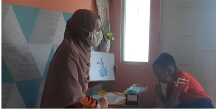
Gambar 4. Penggunaan Flashcard untuk Mengenalkan Kosakata