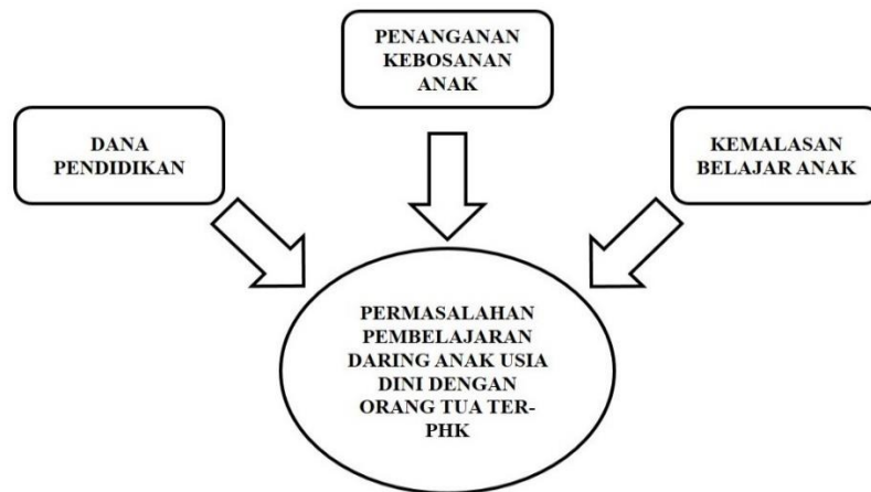
Gambar 2. Bagan temuan penelitian permasalahan pembelajaran daring

Berdasarkan bagan gambar 2 disampaikan pembahasan sebagai berikut: