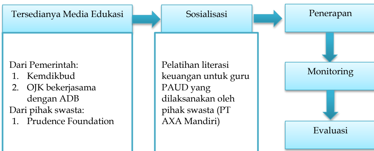
Gambar 3: Skema Strategi Edukasi Literasi Keuangan Untuk Anak Usia Dini

Strategi adalah suatu rencana yang disusun secara cermat untuk mencapai tujuan sasaran khusus (KBBI, 2001). Upaya kerjasama untuk meningkatkan literasi keuangan untuk anak usia dini tidak hanya dilakukan oleh pihak pemerintah tetapi juga dilakukan oleh pihak swasta sebagai partner strategis. Hal tersebut sesuai dengan program yang diusung oleh presiden Joko Widodo jika pembangunan sumber daya manusia akan menjadi prioritas utama.